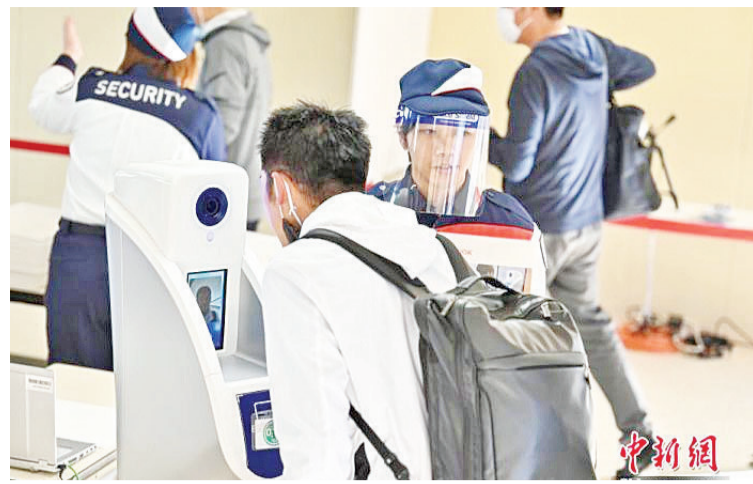
当地时间2020年10月21日，东京奥运会和残奥会组织委员会在东京向媒体公开了，观众等进入赛场时通过的行李安检区运营的实证试验。

巴赫也同时强调，国际奥委会对于疫苗接种始终遵循四项原则，一是为所有人创造一个安全的奥运会