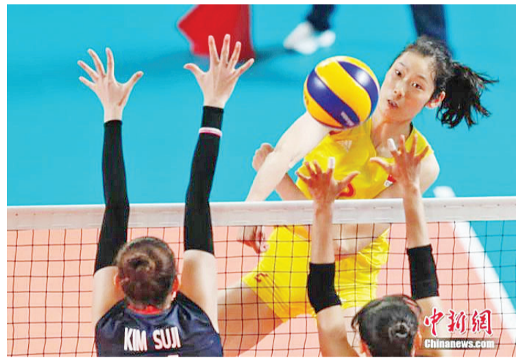
资料图：朱婷在比赛中。