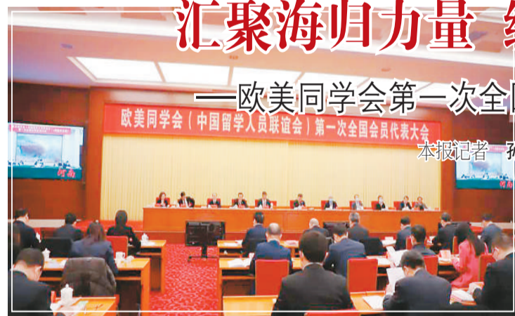
1月21日—22日，欧美同学会（中国留学人员联谊会）第一次全国会员代表大会在京举行。

1月21日，欧美同学会（中国留学人员联谊会）第一次全国会员代表大会在北京召开，这是这家有着百年历史的全国性留学人员组织自成立以来的首次全国会员代表大会。