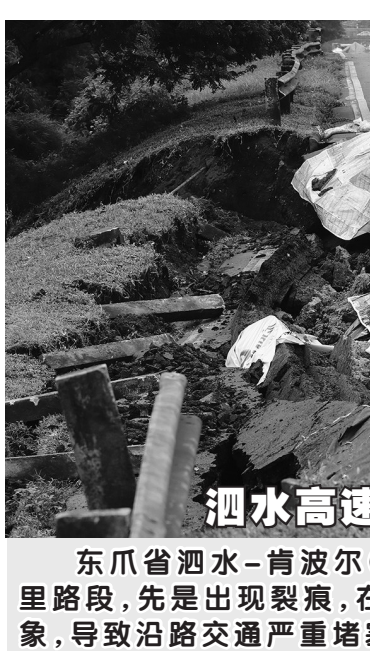
泗水高速公路塌陷 东爪省泗水-肯波尔(Gempol)高速路06+200公里路段,先是出现裂痕,在1月26日终于发生塌陷现象,导致沿路交通严重堵塞。

而且国际社会也纷纷调低对我国今年经济增长预期,认为印尼目前的疫情还非常严重,全年经济增长率不可能达到5.5%,甚至