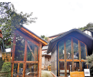
■修繕建築時，部分區域運用玻璃幕牆，體現出新舊對比與設計張力。