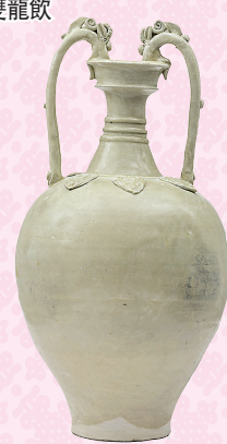
■唐白釉貼花雙龍飲

一個大小相若的唐代白釉貼花雙龍飲，高56.2厘米，但價錢僅約佳士得這件天價拍品的1%-2%，而多年過去，這個唐代雙龍尊升值亦有限。從上述過程中，筆者印證了幾點心得：1.唐代陶瓷形制已成經典範本，後代多有仿製；2.古玩收藏價值不一定以年代久遠來衡量，仿照隋唐（581-907）的清代雙龍尊（雍正1723-1735），竟與早其千餘年的唐代雙龍飲價格如此懸殊；3.宮廷內御用「官窯」製品，當今的收藏價值數以百倍計高於民間「民窯」瓷器。