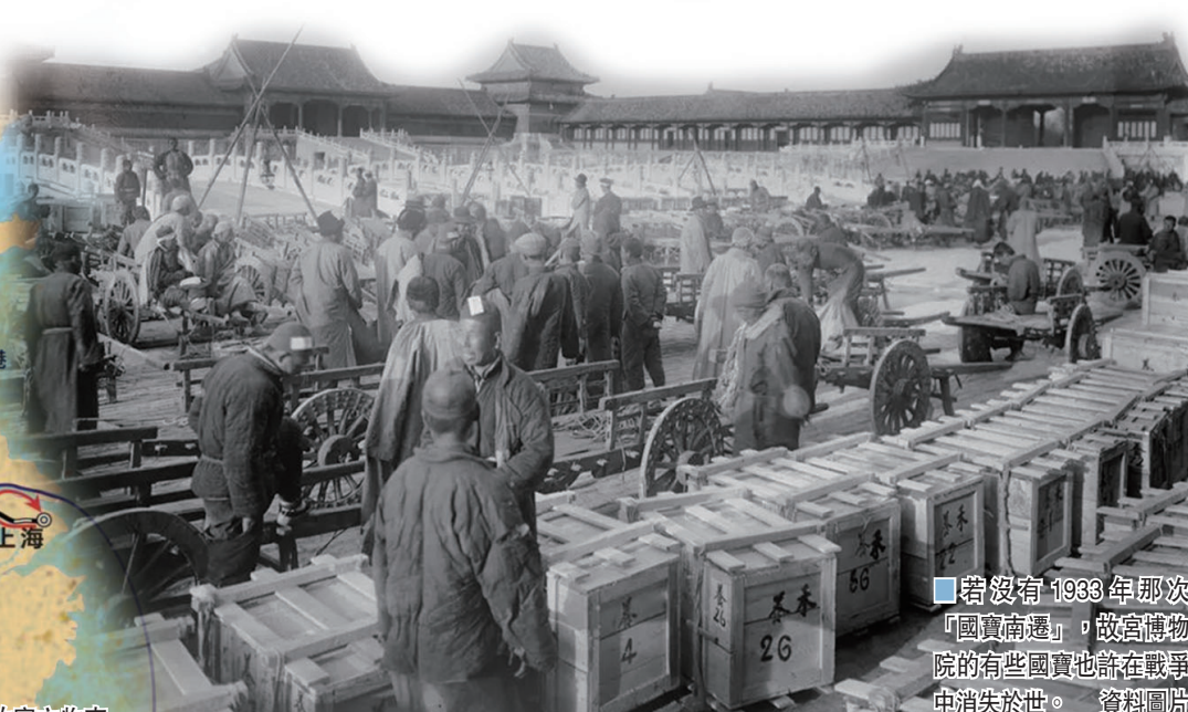
■若沒有1933年那次「國寶南遷」，故宮博物院的有些國寶也許在戰爭中消失於世。資料圖片

故宮文物南遷是故宮博物院乃至中華文化歷史上永遠值得追憶、回味的一頁。若沒有1933年那次「國寶南遷」，故宮博物院的有些國寶也許在戰爭中就此散落世界，更或者消失於世。經過近三年的修繕，落戶在重慶南岸區南濱路安達森洋行舊址的故宮文物南遷紀念館，在2021年元旦初步開放，迎來首批遊客，今年2月將全面對外開放。