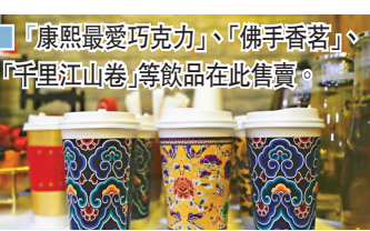
■「康熙最愛巧克力」、「佛手香茗」、「千里江山卷」等飲品在此售賣。

據館方介紹，故宮文物南遷紀念館以「故宮文物南遷」為歷史文脈，既有展示、教育、體驗，亦有博物館少見的休閒功能，目標是故宮大IP打造位於中國西南地區的文化展示平台。