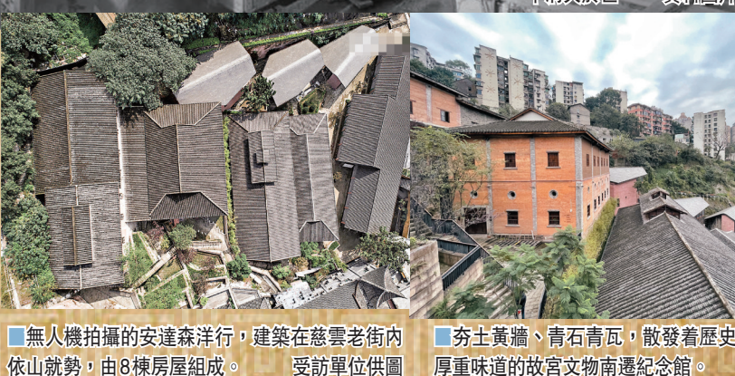
■無人機拍攝的安達森洋行，建築在慈雲老街內依山就勢，由8棟房屋組成。