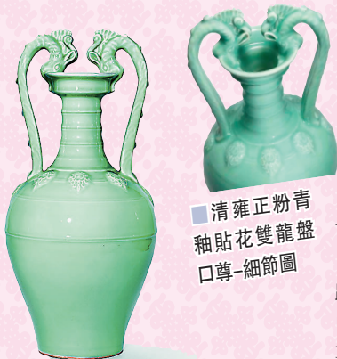
■清雍正粉青釉貼花雙龍盤口尊-細節圖