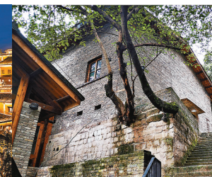
■舊址保留了老黃葛樹、老轎車等元素，使整個區域瀰漫著老重慶的味道。