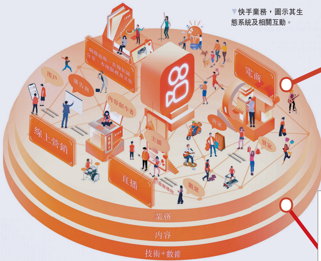
快手業務，圖示其生態系統及相關互動。

集資用途方面，籌款的35%將用於增強生態系統，30%用於加強研發及技術能力，25%將用於選擇性收購或投