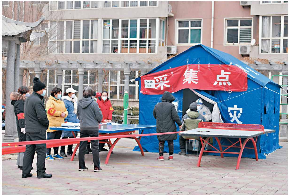
25日下午，石家莊長安區十里鋪社區，醫護人員對居民進行核酸採樣。從1月25日開始，石家莊市中高風險地區和隔離點，每兩天（間隔48小時）進行一次全員核酸檢測。

工作。下午5點30分，記者接受了第四輪核酸檢測。「現在到2月底，依然處於寒冷季節，比較適合病毒生存和傳播，疫情防控非常關鍵，不能有絲毫鬆懈。」張伯禮說，隨著疫情得到控制，居民將逐漸恢復到正常工作生活狀態，但嚴格的疫情防控措施不能少，要做到少聚集、少流動。「春節前後，農村地區婚喪嫁娶也多，要盡量少擺桌、少聚會、少串門。基層衛生機構要警覺起來，對有發熱、咳嗽、咽痛患者尤其要重視，做到早發現、早報告、早隔離、早治療。」