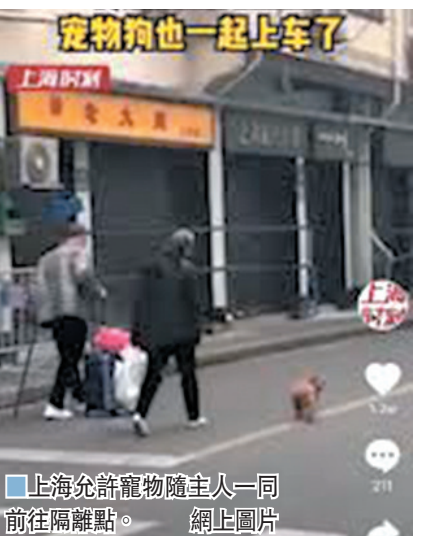
上海允許寵物隨主人一同前往隔離點。網上圖片

香港文匯報訊（記者 章蕪蘭 上海報道）多地曾出現新冠確診患者治癒後復陽，抗疫「攻堅戰」不可掉以輕心。25日舉行的上海市新冠肺炎防控新聞發布會上，市衛生健康委主任鄒韋雷透露，上海本地也有出現過復陽的情況，不過上海一直嚴格開展出院後患者管理及跟蹤隨訪，