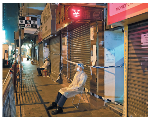
佐敦受限區域內每幢民居的出入口都有檢疫人員把守。