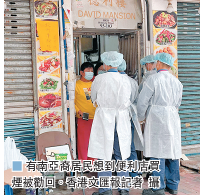
有南亞裔居民想到便利店買煙被勸回。