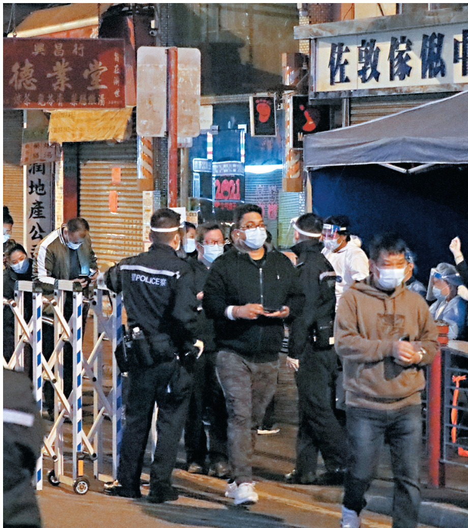
「受限區域」內檢測呈陰性的居民24日晚6時後准許從指定關口登記後離開。