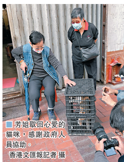
芳姐取回心愛的貓咪，感謝政府人員協助。