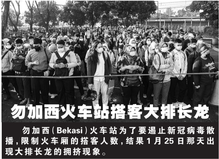
勿加西(Bekasi)火车站为了要遏止新冠病毒传播，限制火车厢的搭客人数，结果1月25日那天出现大排长龙的拥挤现象。

2020年度投资落实价值中，外国直接投资为412.8万亿盾或同比下降2.4%，约占投资落实总额的49.9%。