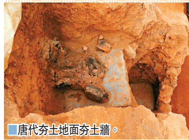
唐代夯土地面夯土牆。