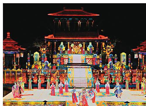
《長恨歌》實景演出舞台設計十分有層次感。