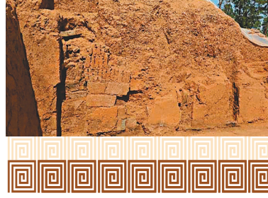
朝元閣遺址出土中原地區罕見的地樑。