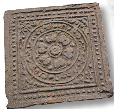
朝元閣遺址出土的灰陶磚瓦。

「春寒賜浴華清池，溫泉水滑洗凝脂。侍兒扶起嬌無力，始是新承恩澤時。」唐代詩人白居易的千古名作《長恨歌》，不僅形象敘述了唐玄宗與楊貴妃迴旋宛轉的愛情悲劇，同時也讓今人有機會一窺大唐皇家園林華清宮當年的極盡奢華。香港文匯報記者日前從陝西省考古研究院獲悉，該院考古人員2020年對唐華清宮朝元閣遺址建築群進行了發掘和清理。經考古發掘證實，朝元閣不僅是唐華清宮驪山禁苑內規模最大的建築群，也是迄今為止發現的唯一唐代高台建築遺址，代表着盛唐皇家建築設計的最高水平。