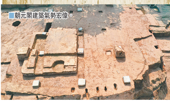
朝元閣建築氣勢宏偉。

據悉，安史之亂後唐王朝由盛轉衰，中晚唐時期，唐帝王便很少遊幸華清宮，朝元閣隨之漸趨衰朽，最晚至北宋開寶三年（公元970年）徹底塌毀。