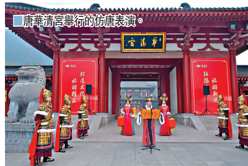
唐華清宮舉行的仿唐表演。