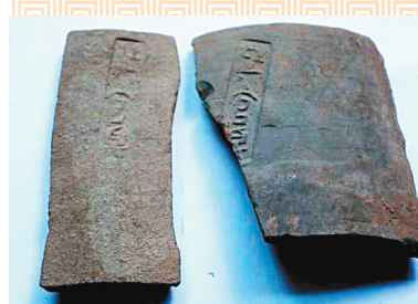
出土的「北六官泉」唐代銘文板瓦。