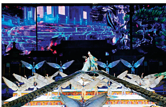
華清宮《長恨歌》實景演出再現唐玄宗與楊貴妃迴旋宛轉的愛情故事。