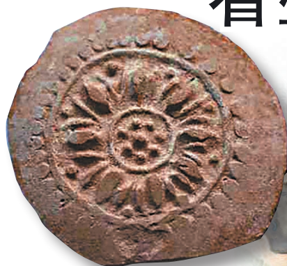
朝元閣遺址出土大量唐代磚瓦。