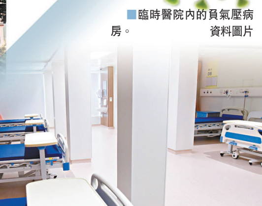
臨時醫院內的負氣壓病房。資料圖片