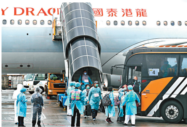
兩地政府緊密聯繫，安排包機接載滯留湖北港人返港。

支援四 去年一月，武漢市政府宣布「封城」，禁止居民離開，數千名港人滯留當地無法回港，其中不乏重病者、孕婦及應屆香港中學文憑試考生。湖北省和武漢市政府與特區政府緊密聯繫，去年先後開展多次撤離行動，每次都動用大批人力物力，採用「封閉式」點對點交通安排。