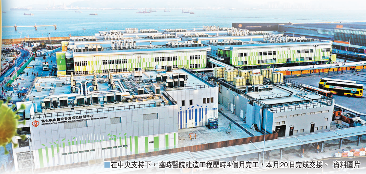
在中央支持下，臨時醫院建造工程歷時4個月完工，本月20日完成交接。資料圖片

香港特區行政長官林鄭月娥前在交接儀式致辭指出，無論物資、核酸檢測、疫苗以至臨時醫院，都體現中央對特區的關愛，也再次說明中央政府永遠是特區最堅強的後盾。她衷心感謝中央政府、廣東省政府、深圳市政府和武漢專家等的支持和指導，並感謝深圳市政府、各個部門和團隊幫助落實臨時醫院建造工程。