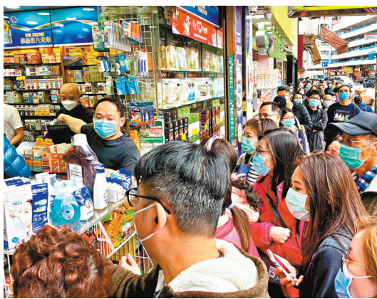
香港去年初出現「口罩荒」，中央政府即向香港提供1,700萬個口罩應急。圖為去年初候購購買口罩的市民。

支援三 去年1月23日，香港出現首宗輸入性的新冠肺炎確診個案。即時引爆「口罩荒」，全港口罩儲備難以供應市民日常使用，大批市民通宵排隊搶購口罩，甚至不惜「天價」購買。