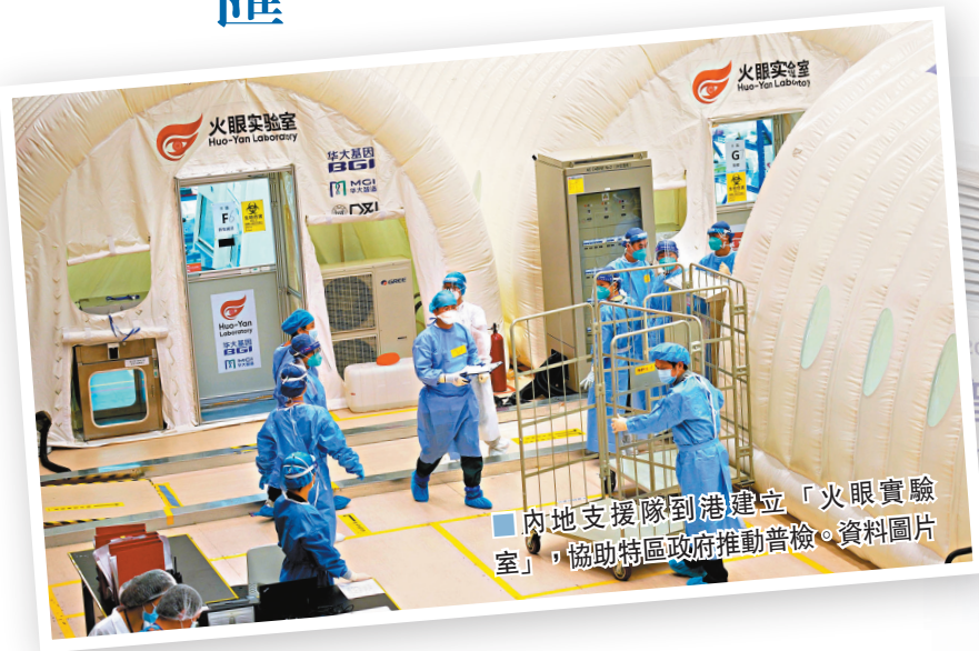
內地支援隊到港建立「火眼實驗室」，協助特區政府推動普檢。