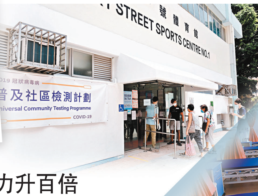
普檢成效卓著，成功截斷逾十條隱形傳播鏈。資料圖片