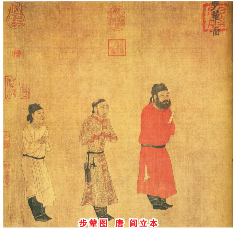
步辇图 唐 阎立本