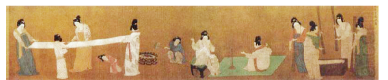
捣练图 唐 张萱