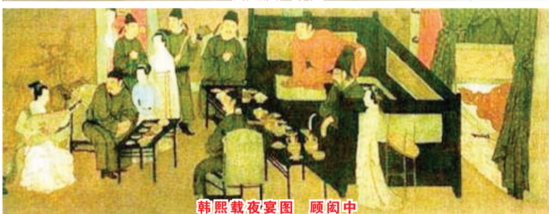
韩熙载夜宴图 顾闳中