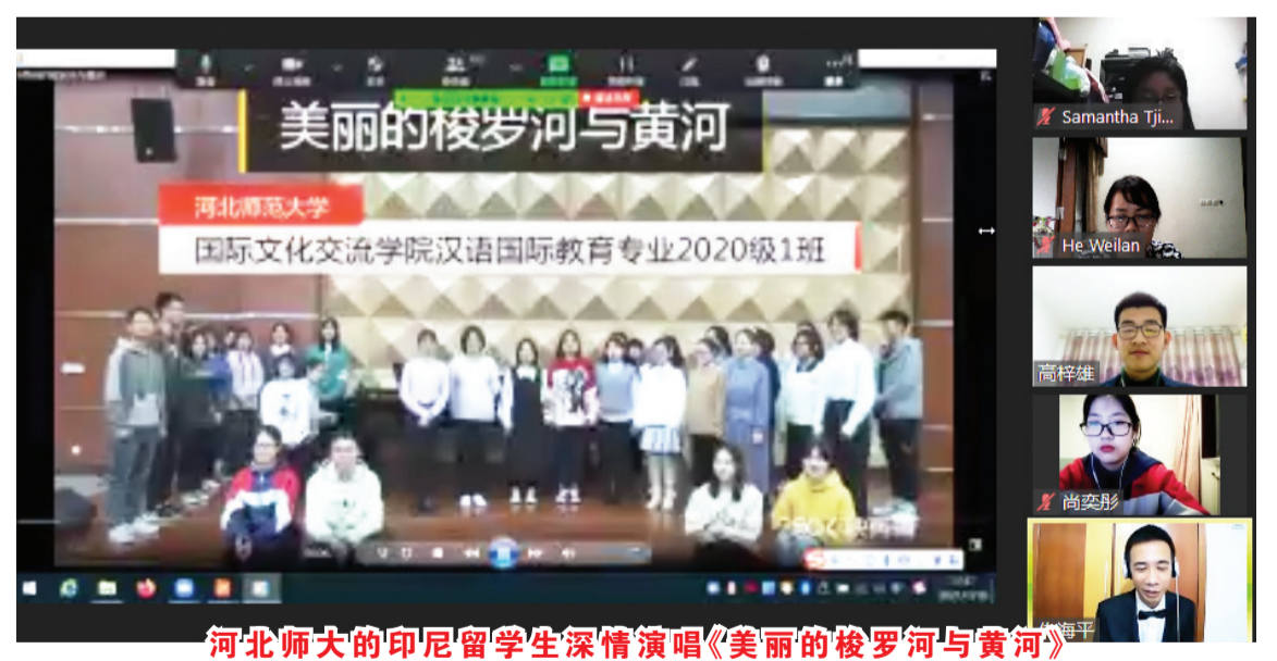
河北师大的印尼留学生深情演唱《美丽的梭罗河与黄河》

美食文化。民以食为天。东北炖菜、麻婆豆腐、酸醋鱼、饺子等中华美食;古城熏肉、武邑扣碗、深州酥糖、郭庄旋饼等河北美食;印尼鱼饼、仁当、椰浆饭等印尼美食无不令人垂涎三尺。老师们详细讲解了所需食材和制作方法,并展示了色香味俱全的美食。建筑文化。中华建筑在