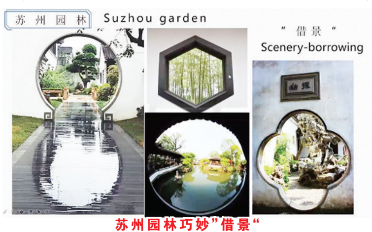
苏州园林巧妙“借景”