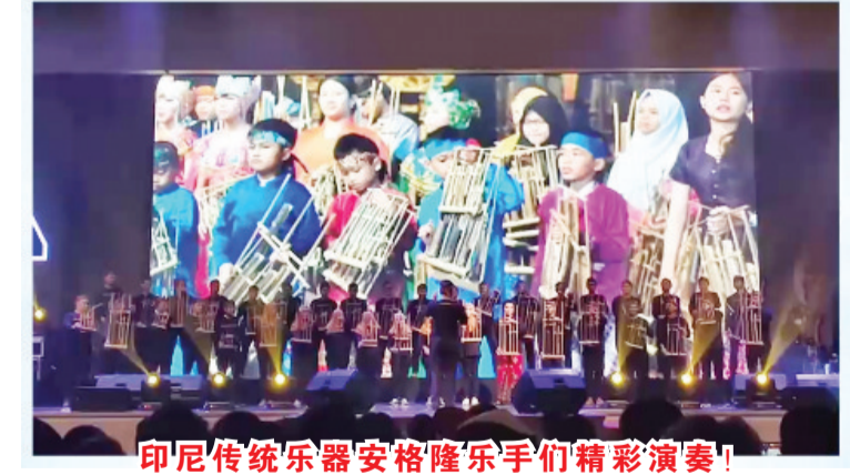
印尼传统乐器安格隆乐手们精彩演奏!

一套安格隆常常需要15人-20人来演奏 Yī tào ān gé lóng chángcháng xūyào 15 rén-20 rén lái yǎnzòu 有时还加上吉他和低音提琴,以加强效果 Yǒushí hái jiā shàng jítā hé dīyīn tíqín, yǐ jiǎqiáng xiànguǒ