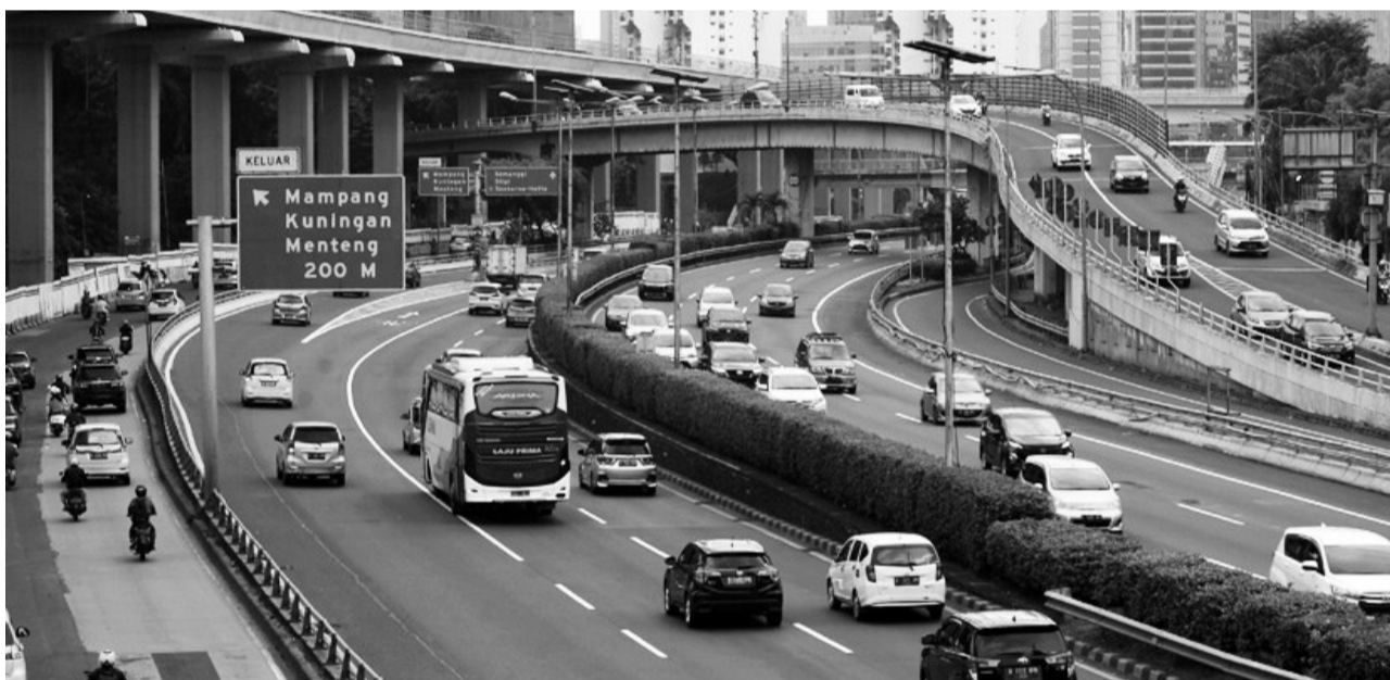
雅加不再列为世界十大最拥堵城市 根据TonTon交通指数,雅加达不再是全球最拥堵的十大城市之一,但在全球416个交通最拥堵城市中排名第31位。图示雅加达在 Gatot Subroto 一带的机动车辆的来往活动。

埃里克深信,印尼的经济到了2023年就能崛起并摆脱困境,前提是从今年开始至明年,需要做好一切的战略准备工作。 为实现上述指标,他提出了四个要点,首先要开拓国内外的清真市场,因为印尼是全球穆斯林人口最多的国家,同时其市场也非常大。 其次是应发展清真金融业,由于现在已进入数字化时代,印尼必须加强现代金融科技和清真金融业。 第三是要提高清真投资,不仅来自国外,但也要来自国内或地方企业家,第四是向乡村提供可持续性和分层的清真业务辅导。 他也要求清真经济共同体的所有利益相关者能前来交换意见并进行协调,使上述四项要点能真正履行。(Sm)