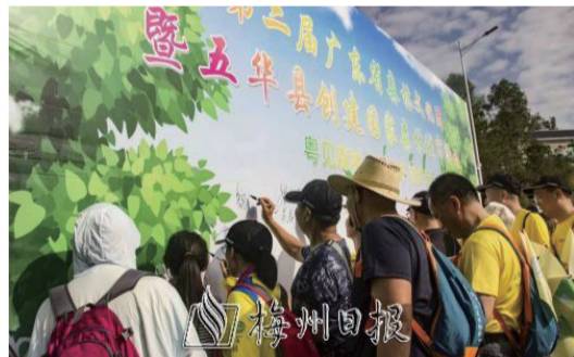
五華縣“創森”系列活動之一——粵見森林，悅見美好，徒步天雲嶺活動