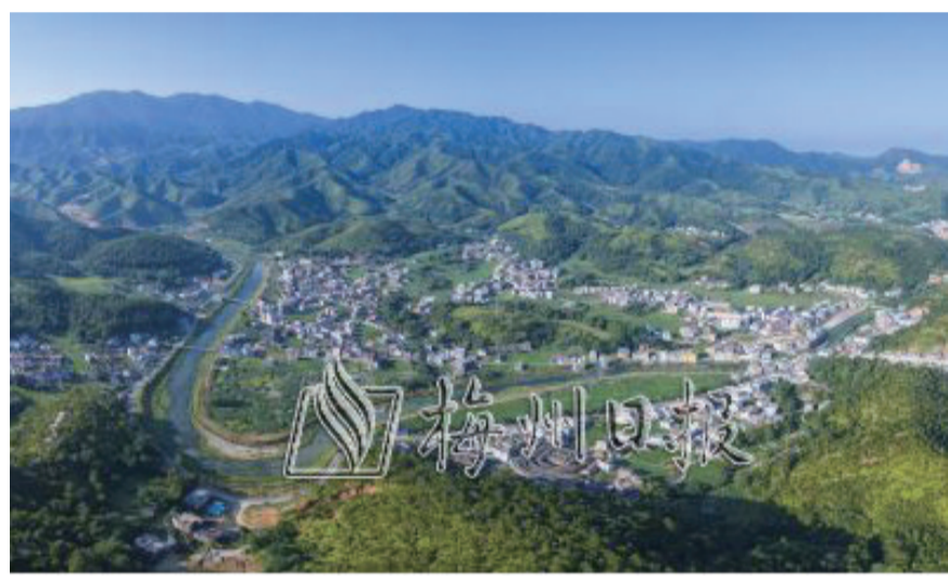
國家級森林鄉村—五華縣郭田鎮郭田村(郭田鎮提供)