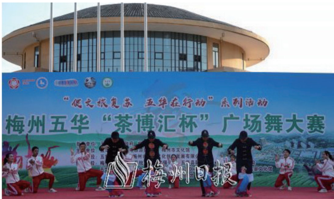
提綫木偶廣場舞隊用提綫木偶表演舞蹈節目。

日前，梅州五華“茶博匯杯”廣場舞大賽落下帷幕。最終，提綫木偶廣場舞隊獲得一等獎，此外還選出二等獎3個，三等獎6個，優秀獎10個。