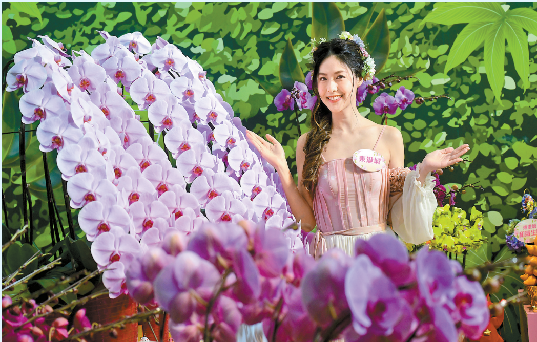
「東港城新春花市限定店」開鑼迎春，宣傳活動上美女與花爭艷。

委員會委員稱，知悉疫苗接種只是新冠肺炎的整體公共衛生應對措施的其中一項工具。當局需要繼續採取非藥物干預的公共衛生策略，包括保持社交距離、維持良好手部衛生和在公眾地方佩戴口罩，以減低傳播風險。