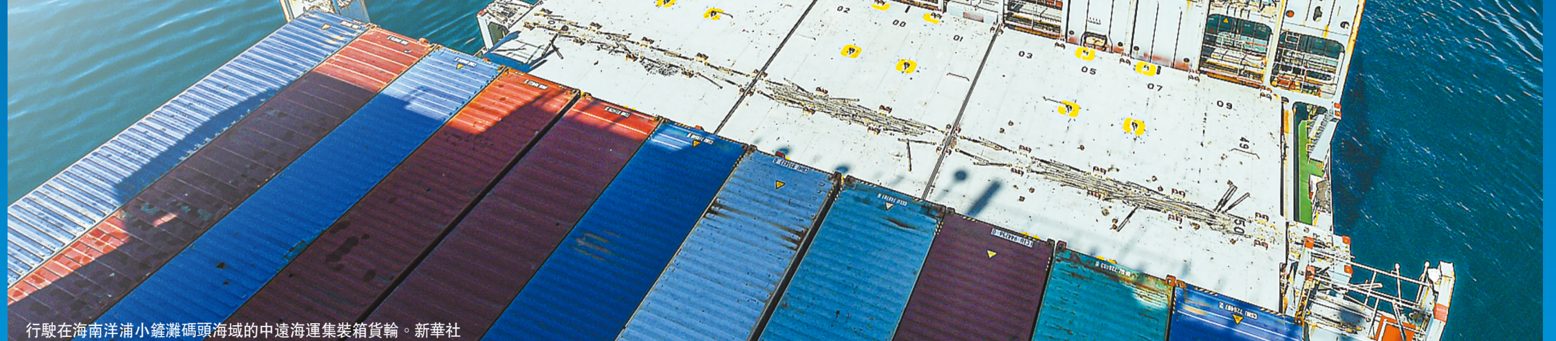
行駛在海南洋浦小蓬瀛碼頭海域的中遠海運集裝箱貨輪。