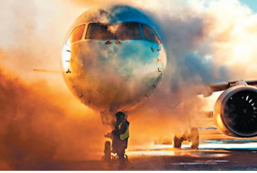
在經歷了20天的測試後，中國國產C919大型客機高寒試驗試飛專項任務近日取得圓滿成功。該客機於去年12月25日飛抵內蒙古呼倫貝爾市海拉爾東山機場開展高寒試驗試飛專項任務，試驗試飛期間，當地最低氣溫已近-40℃。圖為該客機在降落後接受除冰作業。

四川省成都市中級人民法院19日公開宣判第十二屆全國人大內務司法委員會副主任委員秦光榮受賄案，秦光榮受賄金額折合人民幣共計2,389萬餘元，法院以受賄罪判處其有期徒刑七年，並處罰金人民幣一百五十萬元；對其受賄所得財物及孳息予以追繳，上繳國庫。秦光榮當庭表示服從判決，不上訴。