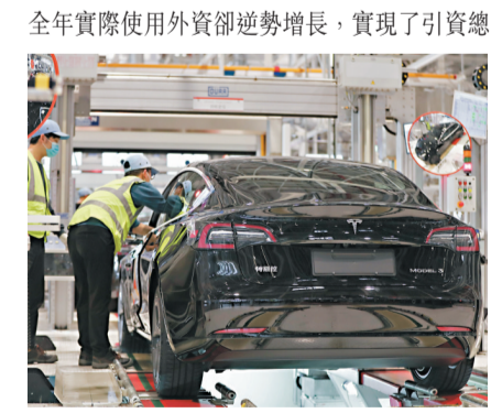
■去年中國實際使用外資同比增長6.2%。圖為特斯拉上海超級工廠內部。資料圖片

香港文匯報訊 據中新社報道，中國商務部新聞辦公室20日表示，2020年全球受新冠肺炎疫情衝擊，致使跨國直接投資大幅下降，惟中國全年實際使用外資卻逆勢增長，實現了引資總