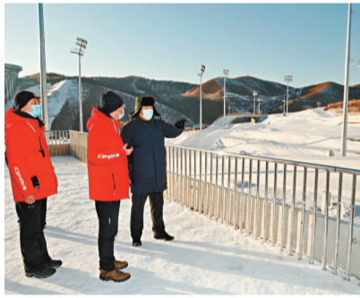
■1月19日，習近平在國家冬季兩項中心考察。新華社