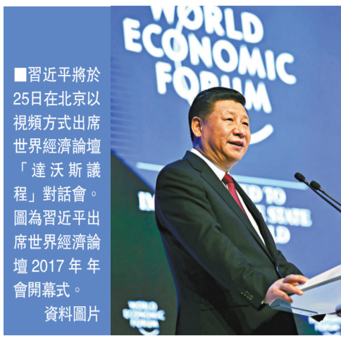
■習近平將於25日在北京以視頻方式出席世界經濟論壇「達沃斯議程」對話會。圖為習近平出席世界經濟論壇2017年年會開幕式。資料圖片

香港文匯報訊 據新華社報道，中國外交部發言人華春瑩19日宣布：應世界經濟論壇創始人兼執行主席施瓦布邀請，中國國家主席習近平將於1月25日在北京以視頻方式出席世界經濟論壇「達沃斯議程」對話會並發表特別致辭。