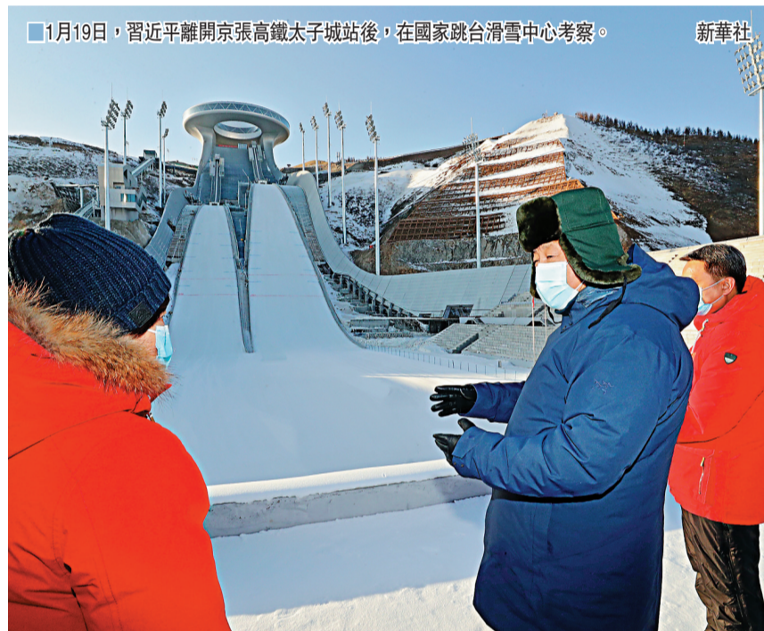
■1月19日，習近平離開京張高鐵太子城站後，在國家跳台滑雪中心考察。新華社