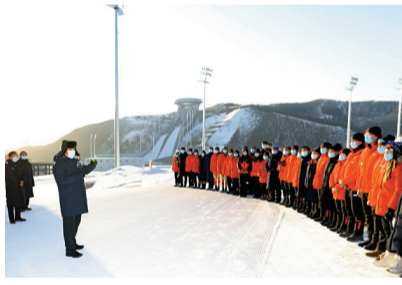
■1月19日，習近平在國家冬季兩項中心同運動員、教練員親切交流。