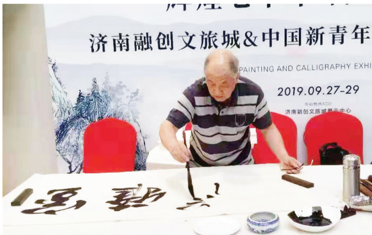
江春现场创作书法