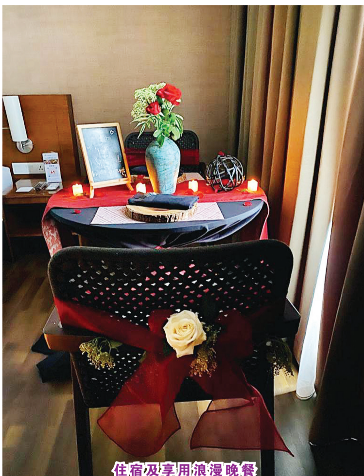
住宿及享用浪漫晚餐

【本报讯】您和您的伴侣是否正在寻找一个放松的蜜月之地，在山上度过浪漫的片刻，并以其心灵假期和静修而著称的美丽景色万隆达戈 (Dago)，这个宁静的目的地提供了一个浪漫的氛围，温度低或更低，并且自然而茂密。