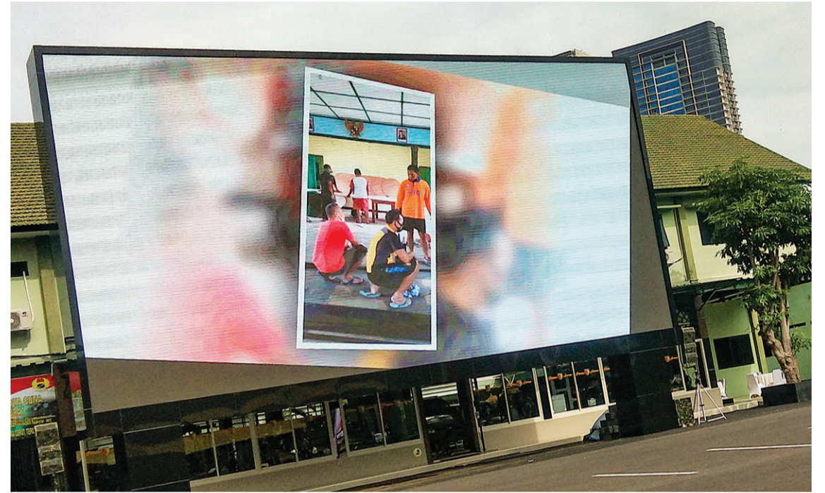
军区司令部放映介绍军区活动短片