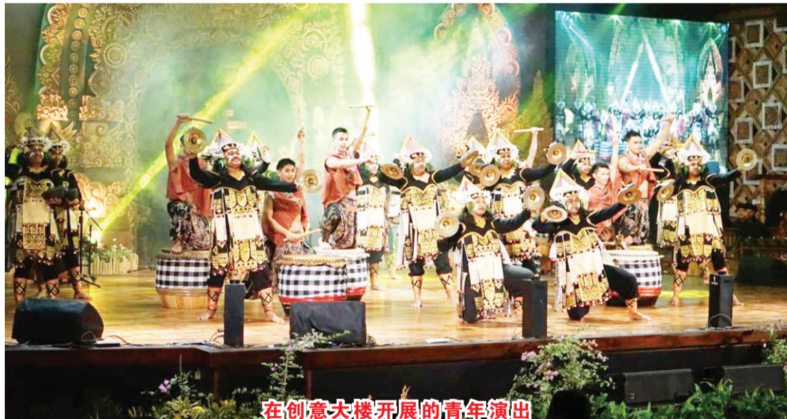
在创意大楼开展的青年演出