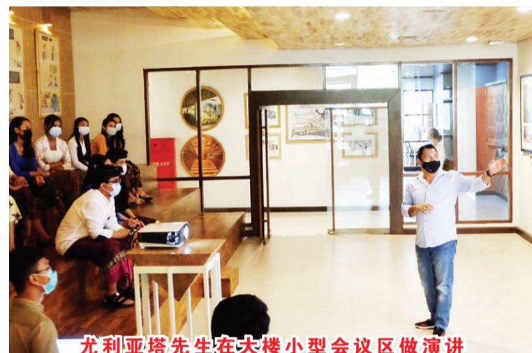
尤利亚塔先生在大楼小型会议区做演讲