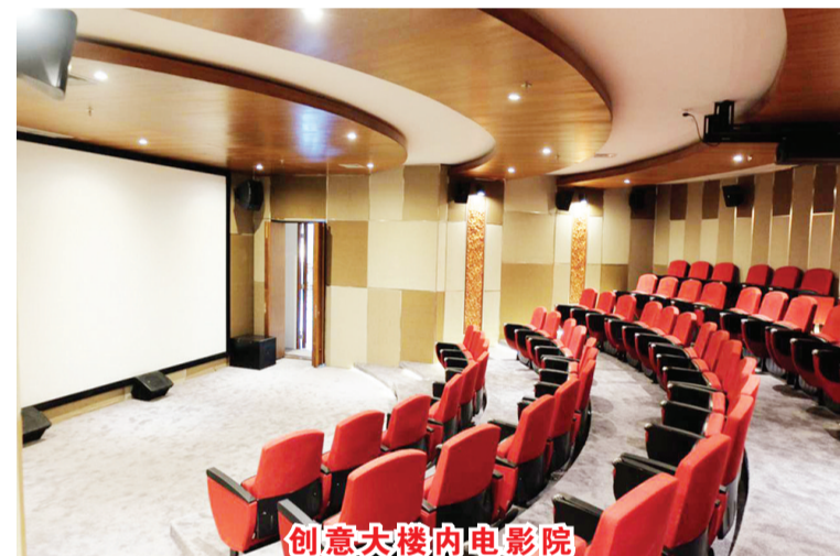
创意大楼内电影院

巴厘岛最具创意的登巴萨创意大楼。创意的定义最为广义,也希望通过此广泛的创意视角来扩展年轻人的创意视野,让登巴萨的文化身份将变得更加牢固,并让未来年轻一代通过创意来实现共同的繁荣与创新。