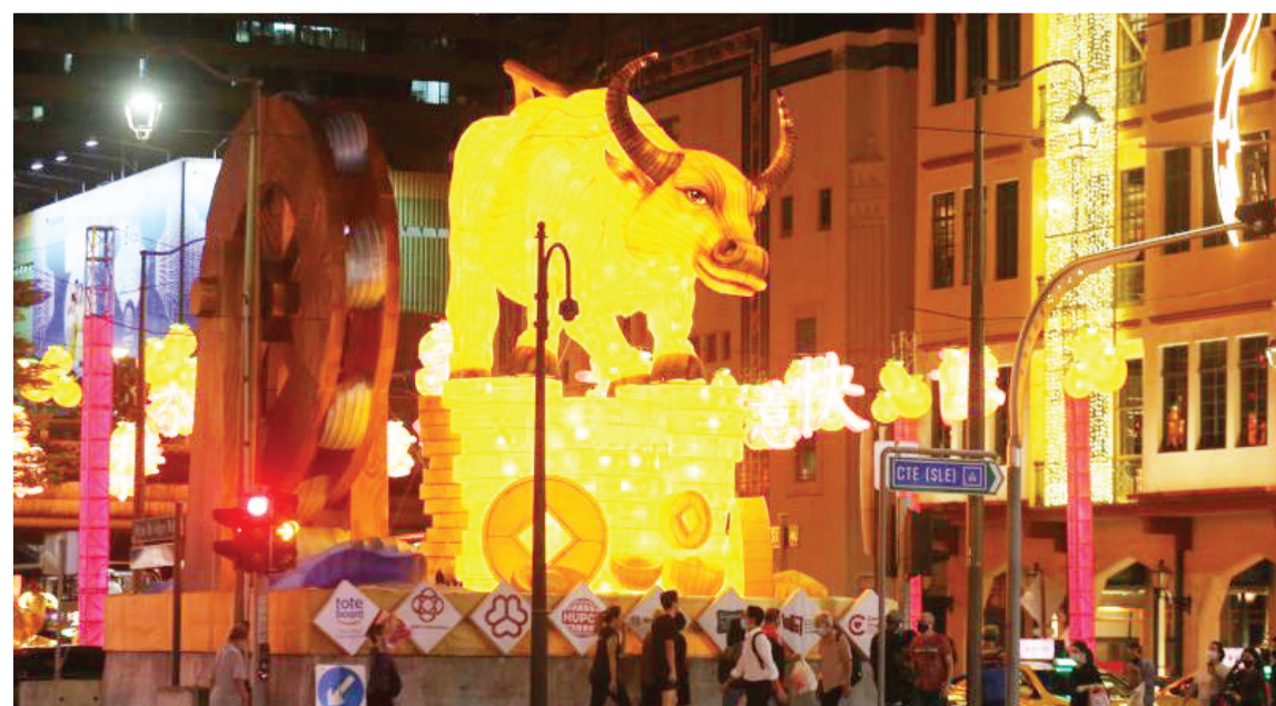
设于唐城坊对面的主灯饰高10米,踩着金币元宝的金牛象征福气和好运,一旁的河岸和水轮则寓意财富,祝愿新的一年一帆风顺。

往年大型亮灯仪式今年将改在牛车水人民剧场举行,100人受邀出席,包括新加坡副总理兼经济政策统筹部长及财政部长王瑞杰。不过,公众仍可通过活动面簿看直播。亮灯仪式将在1月23日晚上8时举行。灯饰会一直展