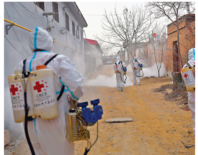
1月14日，志願者在石家莊新樂市蘆新村開展消毒工作。