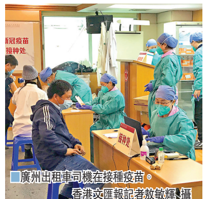
廣州出租車司機在接種疫苗。

張周斌還表示，我國現在緊急使用的新冠疫苗都是兩劑次的免疫程序，建議在第1劑後不少於28天再接種第2劑。這個免疫程序是經過多期臨床試驗後確定下來的最優的接種方法，只接種第1劑而不接種第2劑，效果肯定是會受到影響的。目前廣東已在組織專家開展評估，結合疫苗說明書和相關數