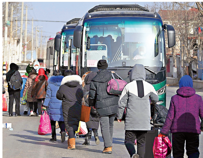
1月11日，石家莊藁城區增村鎮北橋寨村村民們正有序轉移隔離。