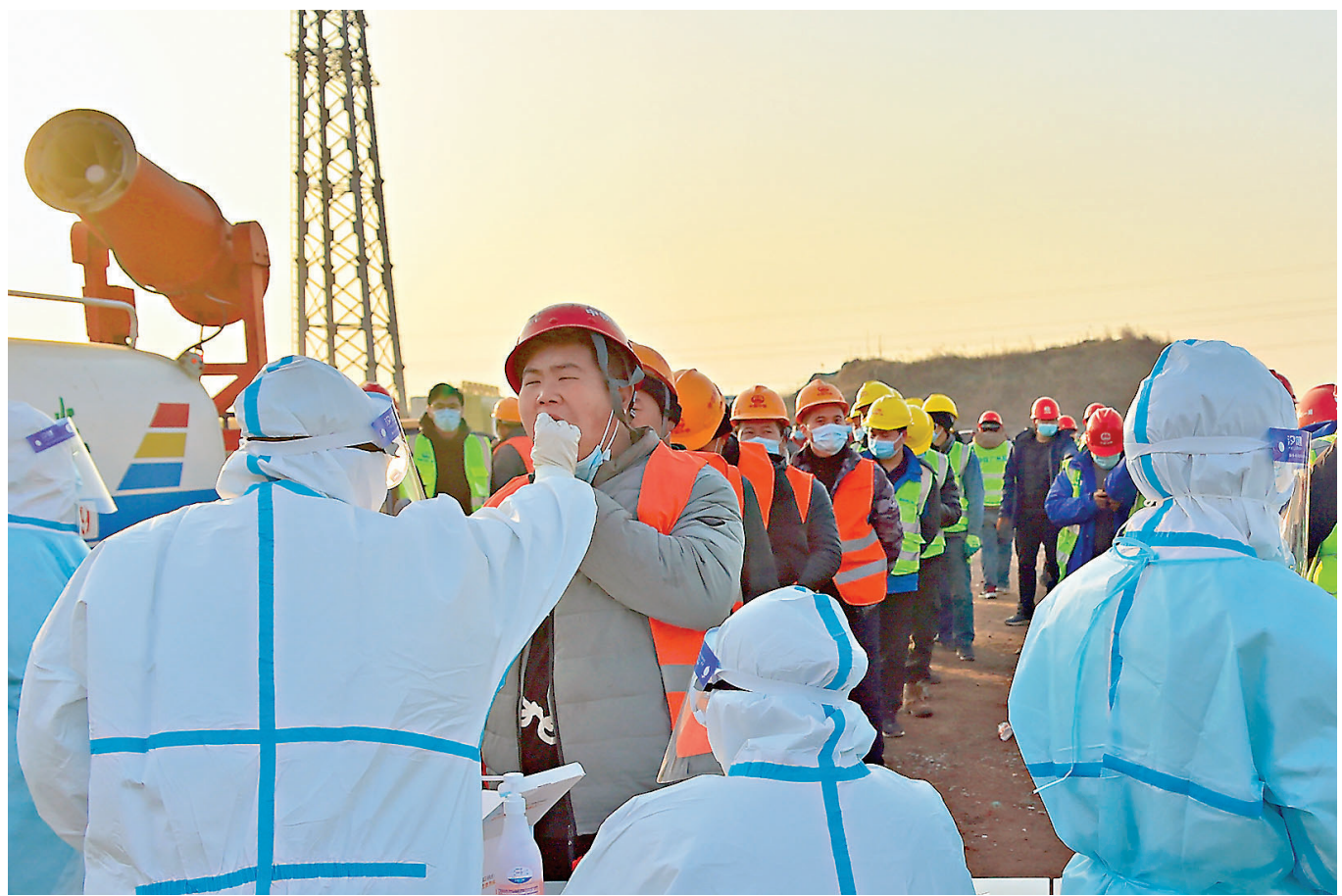
1月18日，石家莊黃莊公寓隔離場所建設工地人員進行核酸檢測。

馬曉偉強調，近期幾起疫情均由境外輸入導致。一些地方在防控過程中出現鬆懈麻痹和消極對付現象，應急指揮體系沒能快速激活。要健全常態化向應急及時轉換的指揮體系，切實做好各項應急處置準備，提高應急處置科學性精準性，加強農村地區疫情防控工作。