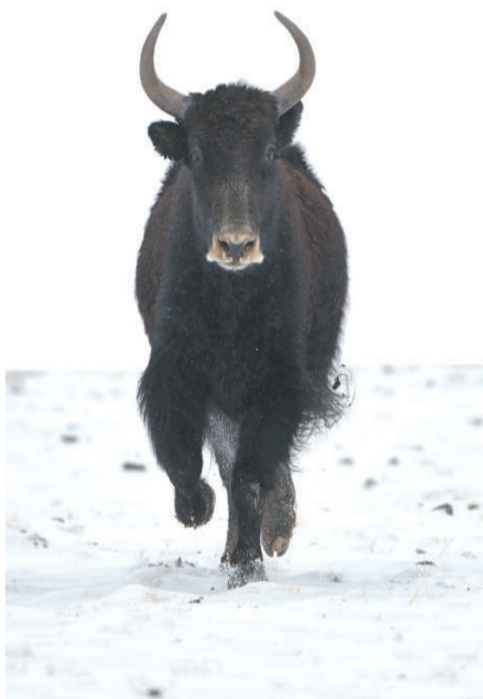
奔跑。哈萨克族自治县阿勒腾乡阿勒腾草原上，一头野牦牛在甘肃省酒泉市阿克塞

斑羚在上方山山林里轻巧跳跃，黔金丝猴在梵净山山间呼朋引伴，朱鹮在千湖湿地繁衍生息，花草树木在阳光雨露滋润下茁壮成长……绿水青山间，野生动植物快乐地生长着，展现出一幅生物多样性的美丽画卷。