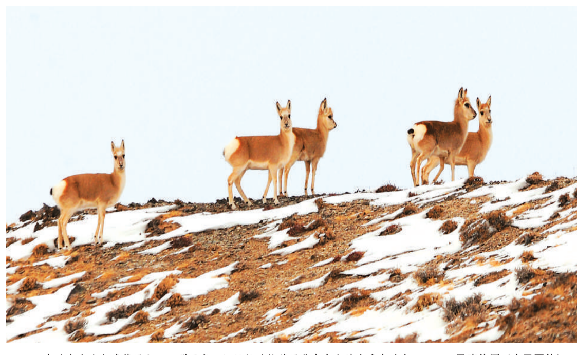
在甘肃省哈尔腾草原上，一群国家二级保护动物藏原羚在自由嬉戏觅食过冬。