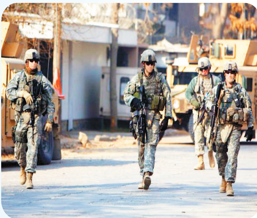
美军士兵在阿富汗首都喀布尔街头巡逻。(资料图片)

近年来，美国白宫不断发布“撤军令”：2018年12月，宣布撤回驻叙利亚美军；2020年6月，宣布大幅裁减驻德美军；9月至11月，几次设定从伊拉克和阿富汗撤军时间表。2011年底，美国从伊拉克撤军，仅留少量军队。2020年2月，美国政府与阿富汗塔利班签署协议。美方承诺在135天内把驻阿美军从大约1.3万人缩减至8600人，剩余的美军和北约联军士兵将在14个月内（2021年5月前）撤离阿富汗。2020年11月，米勒宣布，美国在阿