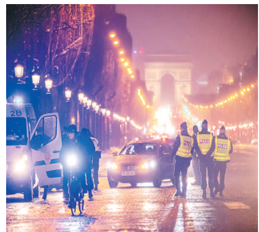
图为1月16日晚，警察在法国巴黎香榭丽舍大街检查车辆。

此外，鉴于新冠疫情形势依然“不稳定”，从1月16日开始，法国将把宵禁实施范围扩大至全国，宵禁时间调整为每日18时至次日6时，有效期至少持续15天。