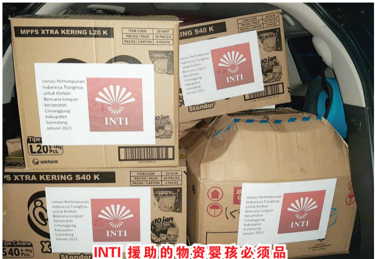
INTI 援助的物资 婴儿必需品