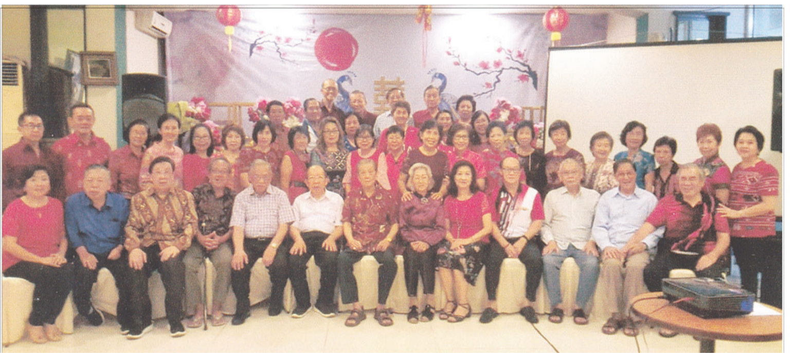
2020 年 1 月 14 日全体文友合影