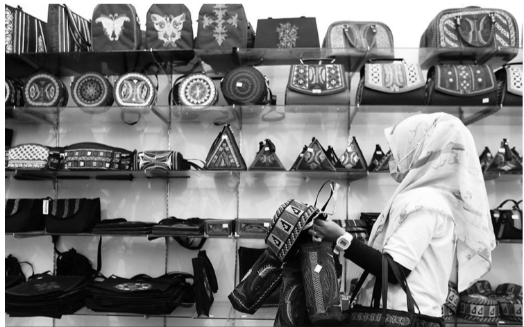
中小微业产品廉价市场 为了推动经济增长尽快复苏，中小微企业在亚齐 Asia Mart Centre 平价市场举办展销市场活动。

康复血浆通常是由已康复的新冠患者捐赠的。由于在2020年有传言说艾朗卡感染新冠病毒，公众对此表示存疑，因为艾朗卡从未正式宣布这一消息。