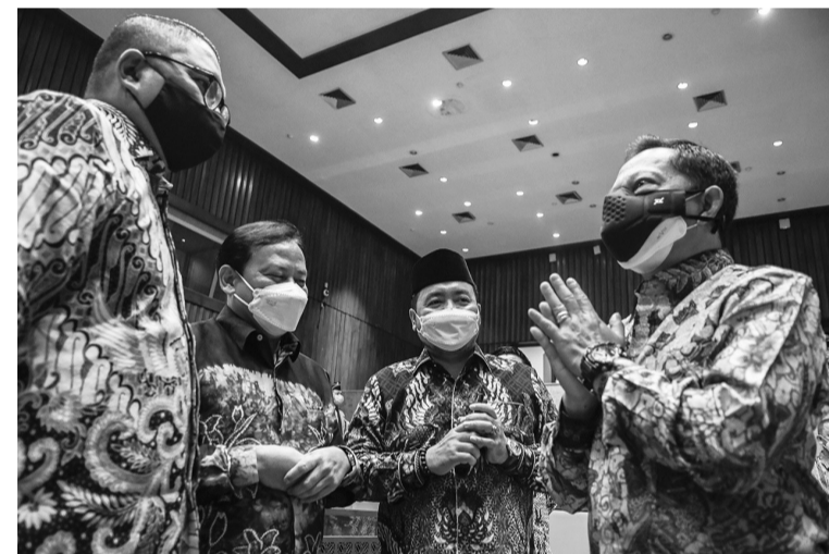
内长和国会第二委会举行工作会议 1月19日，内政部长迪托(Tito Karnavian/右)同国会第二委员会举行工作会议，讨论有关2020年同步举行地方首长选举活动的评估事项。

据赫鲁说，去年就听说艾朗卡新冠病毒检测呈阳性，但他不知道确切的日期。赫鲁推测，艾朗卡可能已向相关部长或高官私下说明，也许为了国家利益，例如使经济统筹部的所有活动都能照常进行，避免经济受到干扰，艾朗卡不便公布感染新冠病毒的消息。