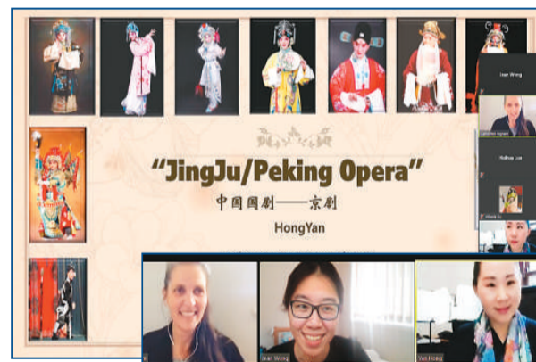
《中国京剧》线上讲座截图。

我一一回应：中国民歌讲究润腔，二维的乐谱无法记录润腔的动态变化，所以造成了谱面与实际演唱的差异；京剧的角色分工是按照行当作为依据的，