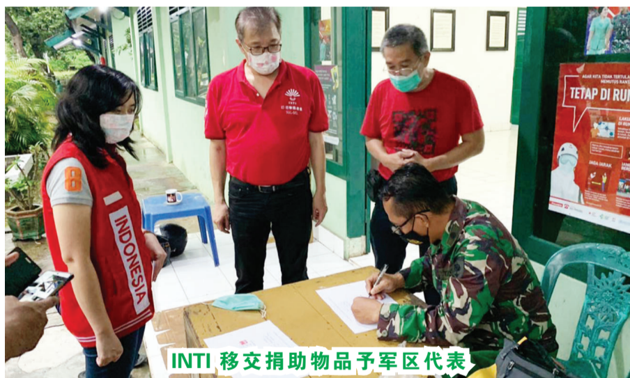
INTI 移交捐助物品予军区代表