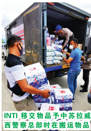
INTI 移交物品予中苏拉威西警察总部时在搬运物品