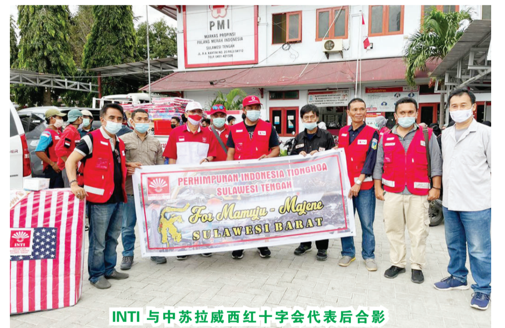
INTI与中苏拉威西红十字会代表后合影

刷牙和肥皂等。至于Palu是由INTI南苏拉威西与第XIV军区Hasanuddin司令部合作移交的: 速食面650盒(40包/每盒), 大米80袋(25公斤/每袋)、10000医用品