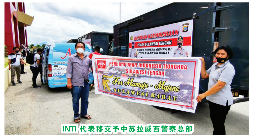
INTI 代表移交予中苏拉威西警察总部