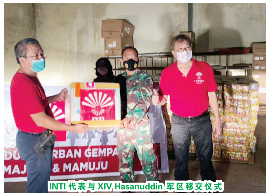
INTI代表与XIV Hasanuddin 军区移交仪式

此外还分发500公斤大米、100包大米(10公斤/每包)、5箱鱼罐头、10个防水油布帐篷、5箱食用油、8个床垫、毛毯、牙