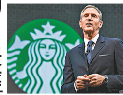
星巴客公司董事會名譽主席霍華德·舒爾茨。

香港文匯報訊 據新華社報道1月6日，國家主席習近平覆信美國星巴客公司董事會名譽主席霍華德·舒爾茨，鼓勵其與星巴客公司為推動中美經貿合作和兩國關係發展繼續發揮積極作用。習近平在覆信中強調，在中國共產黨領導下，14億中國人民為全面建成小康社會、建設社會主義現代化進行長期艱苦努力。中國開放全面建設社會主義現代化國家新征程，將為包括星巴客等美國企業在內的世界各國企業在華發展提供更加廣闊的空間。希望星巴客公司為推動中美經貿合作和兩國關係發展作出積極努力。此前，舒爾茨致信習近平主席，祝賀中國在習近平主席領導下即將全面建成小康社會，表達其對中國人民和中華文化的敬意。