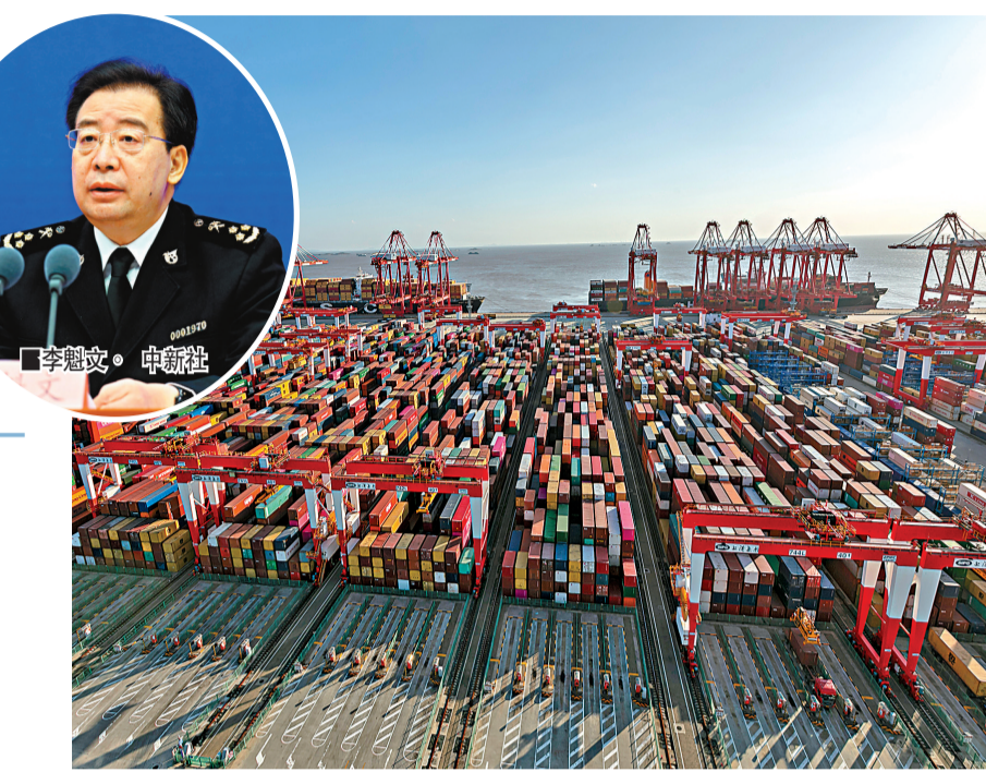
中國海關總署14日公布的最新數據顯示，2020年中國外貿進出口總值32.16萬億元人民幣，同比逆勢增長1.9%，規模創歷史新高。圖為上海洋山港集裝箱碼頭。

香港文匯報訊 綜合報道：中國海關總署14日公布的最新數據顯示，2020年中國外貿進出口總值32.16萬億元（人民幣，下同），同比逆勢增長1.9%，規模創歷史新高。海關總署新聞發言人、統計分析司司長李魁文介紹，中國成為全球唯一實現經濟正增長的主要經濟體，外貿規模再創歷史新高，國際市場份額也創歷史最好紀錄。「這充分體現了我國外貿的強大韌性和綜合競爭力。可以說，既實現了穩定增長，也實現了質量提升。」