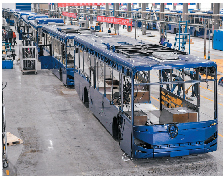
■2020年內地社會融資規模增量累計為34.86萬億元，比上年多9.19萬億元。其中，對實體經濟發放的人民幣貸款同比增加3.15萬億元。