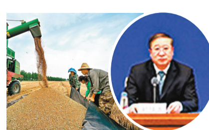
13日，農業農村部副部長劉焯鑫介紹，實施鄉村振興戰略是黨的十九大的重大決策部署。網上圖片

作為農業「芯片」，種子行業的發展水準直接關係中國糧食安全的命脈。據了解，2020年中國已建成8億畝高標準農田，農作物良種覆蓋率穩定在96%以上，農作物自主選育品種面積佔比超過95%，目前中國種子供給有保障。