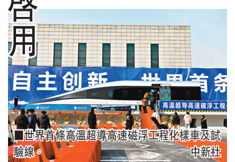
世界首條高溫超導高速磁浮工程化樣車及試驗線。

據了解，作為一種新興高速交通模式，高速磁浮具有速度高、安全可靠、噪音低、震動小、載客量大、耐候準點、維護量少等優點。目前，高鐵最高運營時速為350公里，飛機巡航時速為800至900公里，時速600公里的高速磁浮可以填補高鐵和航空運輸之間的速度空白，對完善中國立體高速客運交通網具有重大的技術和經濟意義。