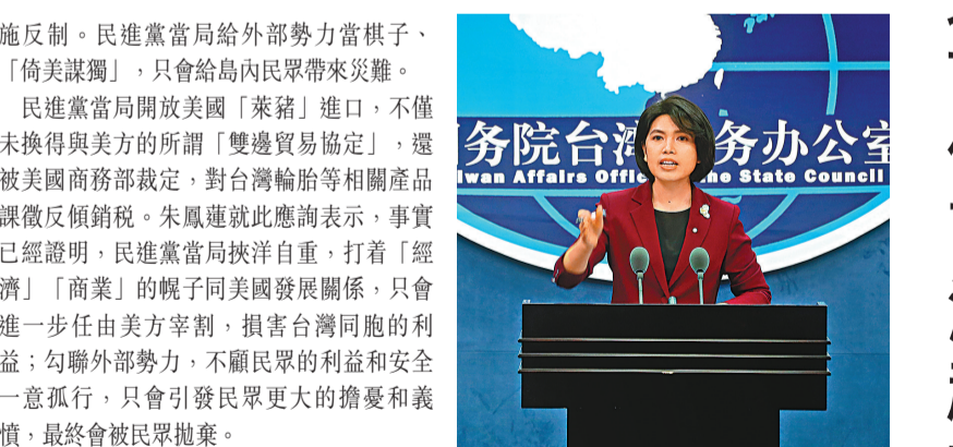
國台辦發言人朱鳳蓮重申，中方堅決反對美方與中國台灣地區進行任何形式的官方往來，要求美方立即停止錯誤做法。資料圖片