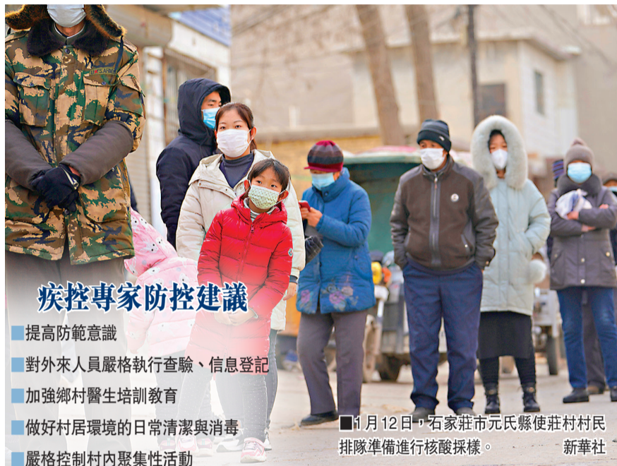
1月12日，石家莊市元氏縣使莊村村民排隊準備進行核酸採樣。

抗擊 新冠肺炎 香港文匯報訊 綜合報道：據河北省衛生健康委員會通報，1月12日，河北省新增90例本地新冠肺炎確診病例。在石家莊市新增確診病例中，有多例經多次核酸檢測才呈陽性。其中，至少5名確診病例第五次核酸檢測才呈陽性。為防止疫情進一步擴散，河北省對石家莊、邢台、廊坊3市全域實行封閉管理，人員、車輛非必要不外出。由於河北本轮疫情主要分布在農村地區，且農民佔所有病例的70.07%。專家指出，加強基層尤其是農村疫情防控制將是工作重點。國家衛健委13日指出，大部分農村地區的醫療條件薄弱，防控能力相對比較弱，且春節大量人員返鄉過年。要通過做好重點人群摸排，提高鄉鎮衛生院、村衛生室和個體診所對新冠疫情的發現報告意識，疫情發生迅速響應，全面開展疫情防控制等6個方面的措施做好疫情防控工作。