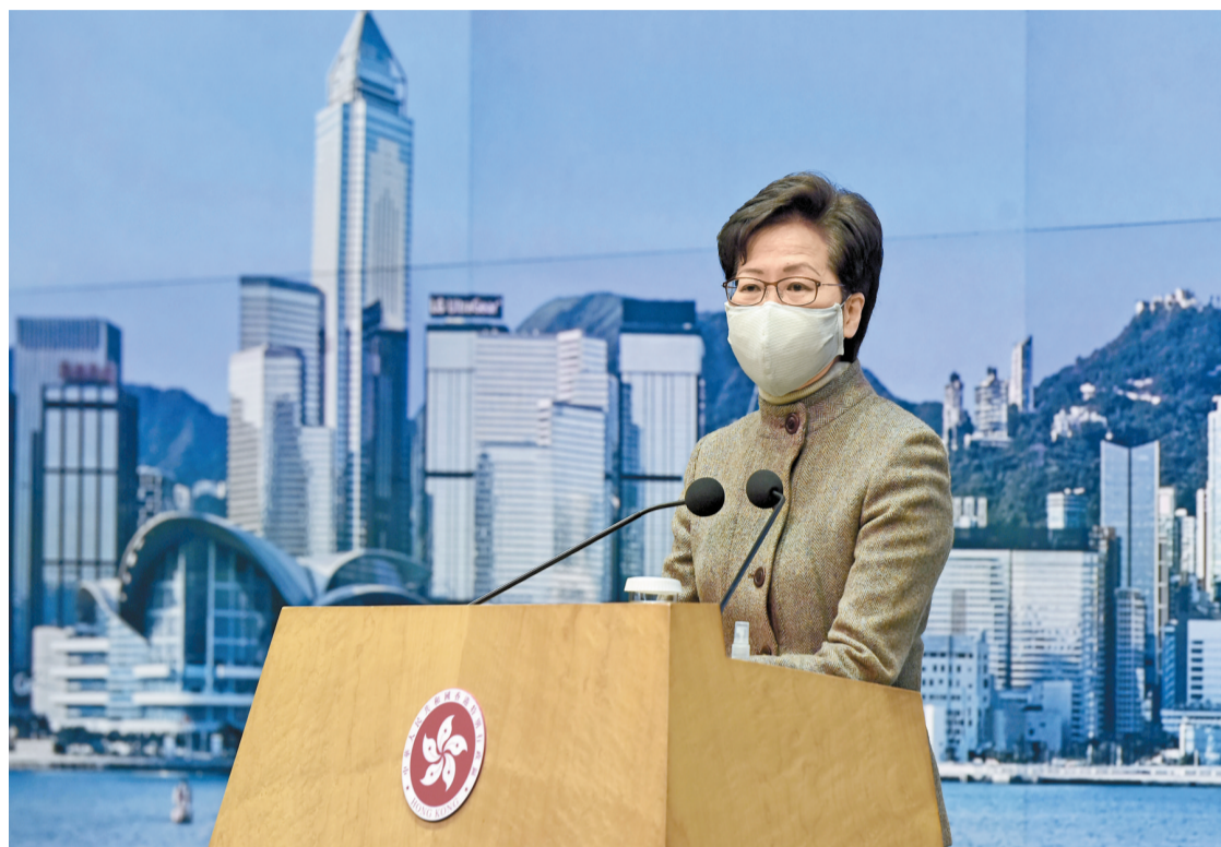
林鄭月娥昨指出，區議員及選舉委員會委員應該被優先視為公職人員，須按照國安法的要求進行宣誓。

【香港商報訊】記者馮仁樂報道：特區政府擬修例完善公職人員宣誓安排，外界十分關注會否將區議員亦納入。昨日，行政長官林鄭月娥出席行政會議前表明，區議員及選舉委員會委員應被優先視為公職人員，須要按照香港國安法的要求進行宣誓。此外，因應外國政客就警方早前拘捕行動作出失實指控，林鄭重申，香港是法治社會，法律面前人人平等，希望外國社會看待中國、香港內部事務時放下雙重標準。