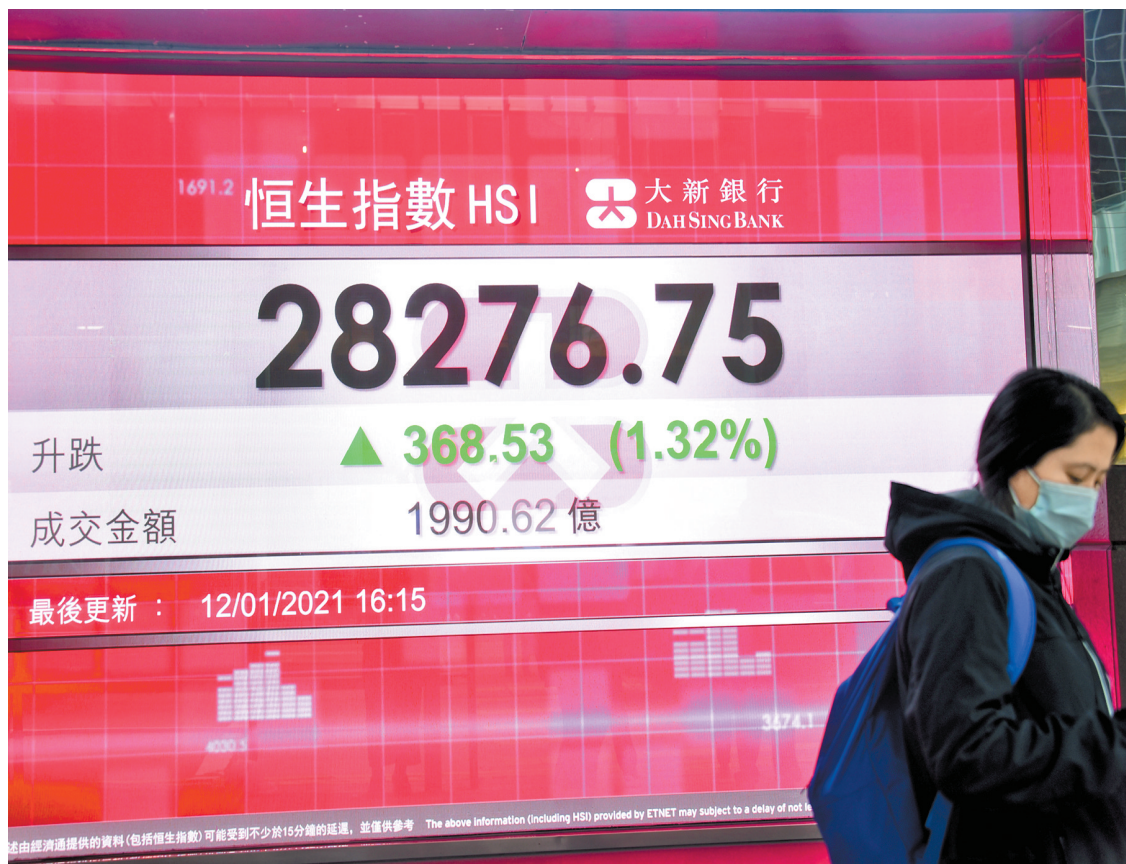
港股昨升368點至28276點，升穿28000點大關，創近一年高位。

【香港商報訊】記者姚一鶴報導：南下資金追捧港股情緒高漲，昨日港股雖然低開，其後走勢一路向上，最終以全日最高位收市。南下資金昨日淨流入港股117.36億元，流入規模雖較前一交易日減少約70億元，但流入規模仍然維持在高位，恒指收報28276點，升368點或1.3%，創去年1月22日後近一年高位。