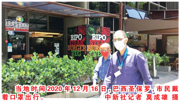
当地时间2020年12月16日,巴西圣保罗,市民戴着口罩出行。

中新社北京1月13日电 综合消息:世界卫生组织公布的最新数据显示,截至欧洲中部时间12日17时40分(北京时间13日零时40分),全球新冠肺炎确诊病例较前一日增加566186例,累计达89707115例;死亡病例增加9371例,累计达1940352例。