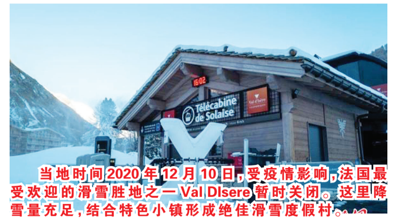
当地时间2020年12月10日,受疫情影响,法国最受欢迎的滑雪胜地之一Val Disere暂时关闭。这里降雪量充足,结合特色小镇形成绝佳滑雪度假村。

马拉维总统查克维拉12日宣布,因新冠疫情严重恶化,马拉维所有地区从即日起进入国家灾难状态。查克维拉呼吁国际社会提供更多援助,以帮助