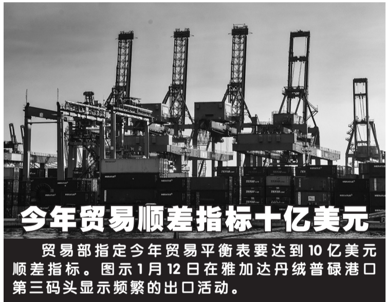
今年贸易顺差指标十亿美元 贸易部指定今年贸易平衡表要达到10亿美元顺差指标。图示1月12日在雅加达丹绒普禧港口第三码头显示频繁的出口活动。

2020年QRIS使用者已达到580万营业者,其中占84%是微型和小型企业家。往后央行将承诺,与政府各部门及机构共同推动中小微型企业的发展,以期他们对国家经济有所贡献。 (Ing)