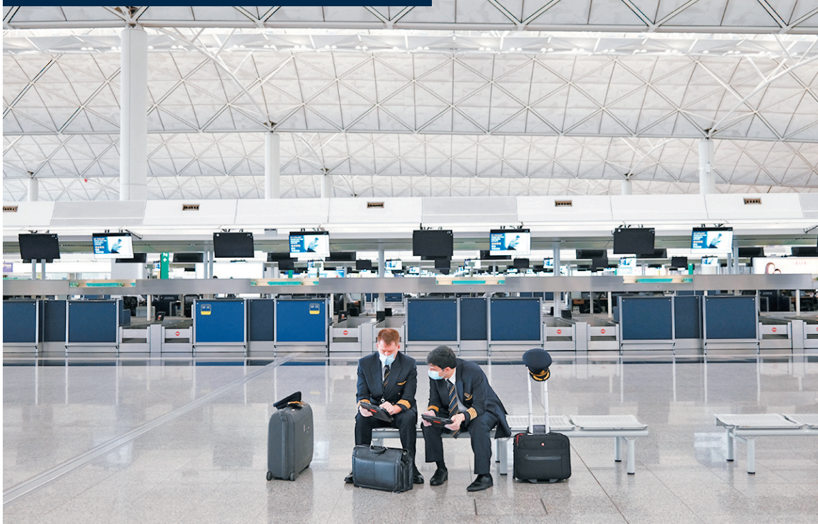
■整個2020年都受疫情困擾，旅遊業幾乎全面停頓，航空業首當其衝。