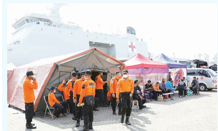
各相关单位在码头搭盖帐篷彻夜展开搜救。中新网雅加达1月11日电(记者林永传)11日,雅加达丹戎不碌港的印

尼三佛齐航空公司SJ182航班客机失事搜救指挥中心时看到,各部门的搜救工作正全力推进。