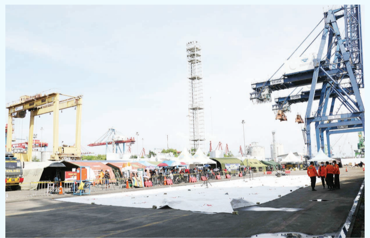
在搜救指挥中心待命的搜救人员。

经过两天现场搜救,搜救人员判断乘客生存的希望已十分渺茫。两天来,搜救人员在事发海域已多次打捞起遇难者遗体移交给负责死者