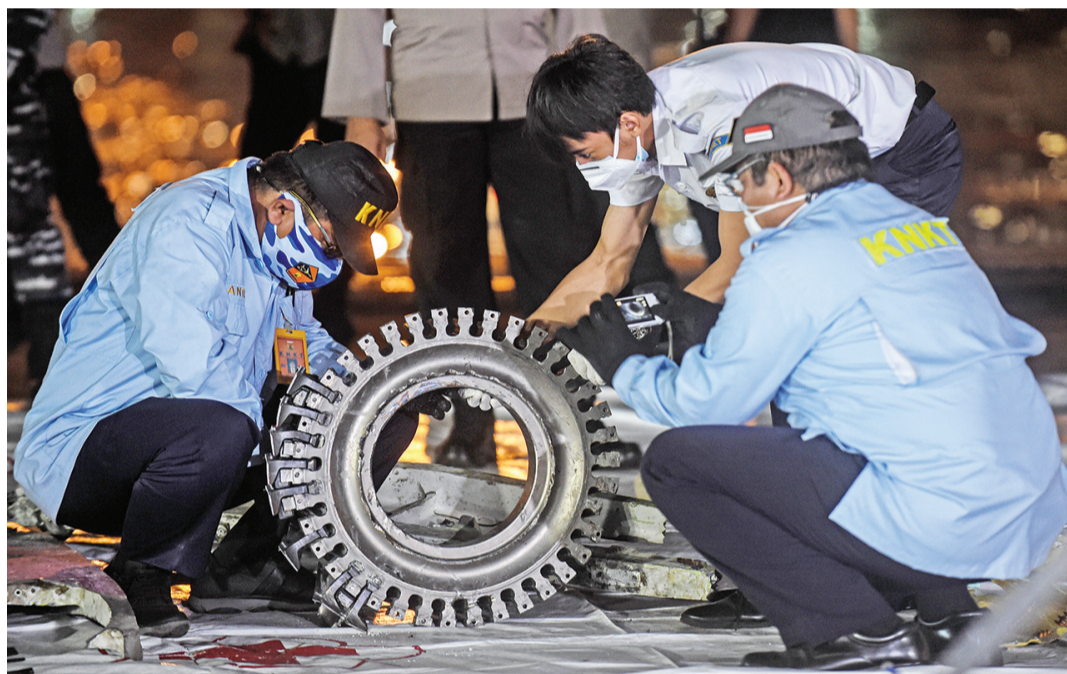
1月10日,搜救人员在雅加达戈戎不碌港查看失事客机残骸。

新华社雅加达1月10日电 新华社记者梁辉古鲁1月10日,位于印度尼西亚首都雅加达北区的丹戎不碌港气氛紧张,不时有警车、救护车闪烁着驶过。印尼三佛齐航空公司失事客机临时搜救指挥中心就设在港口的2号国际集装箱码头。