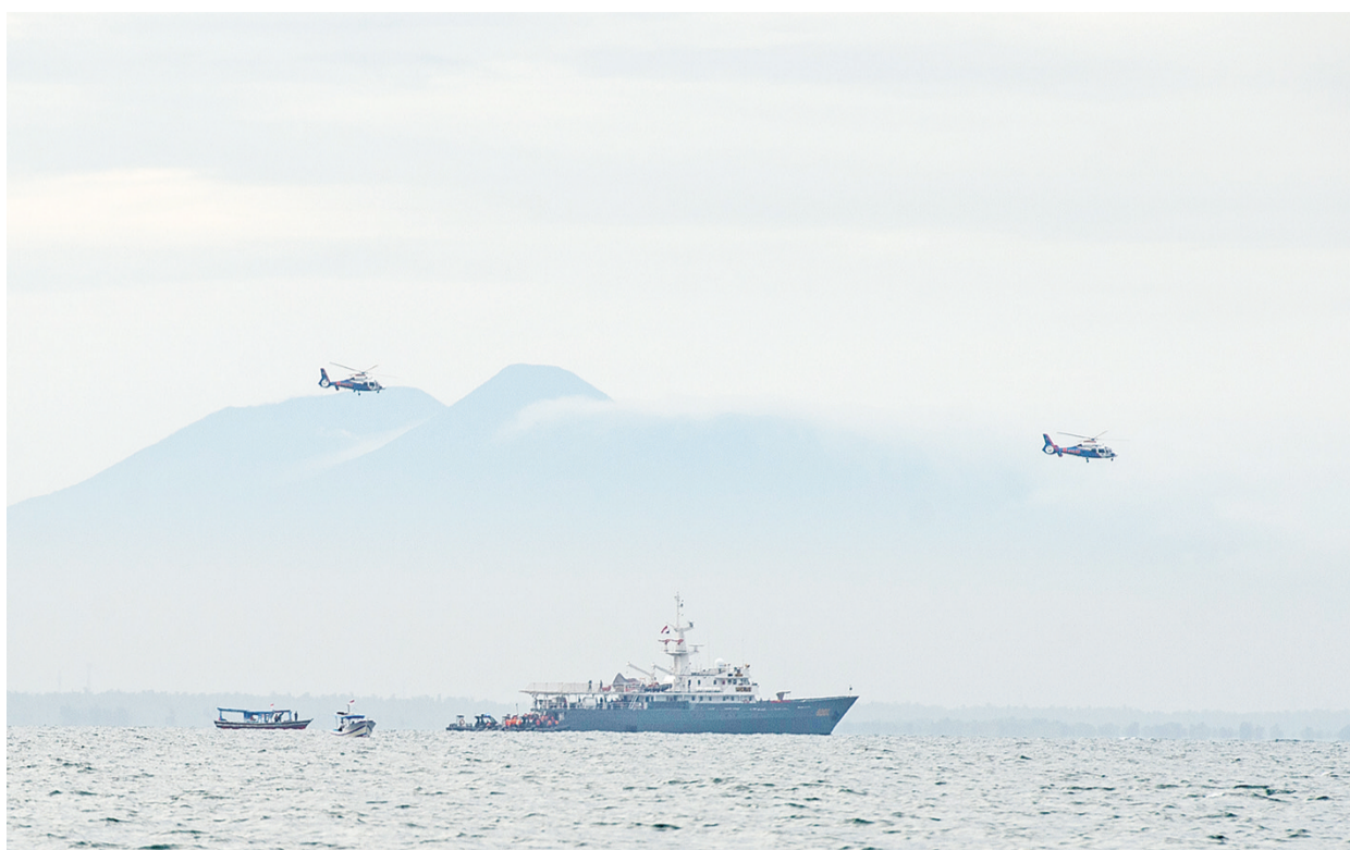
1月10日,搜救船只在雅加达千岛群岛区域的海域展开搜索。

习近平在慰问电中表示,惊悉印尼一架民航客机失事坠毁,作为印尼的友好邻邦,我谨代表中国政府和人民,对遇难者表示深切的哀悼,向遇难者家属致以诚挚的慰问。