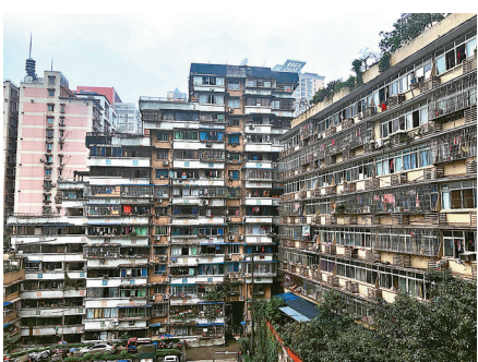
24層高卻沒有電梯的魔幻網紅建築白象居

在繁華鬧市中，有一座上世紀90年代初建成的高層住宅群「白象居」，24層高卻沒有電梯、破敗簡陋的房屋與對面的繁華喜來登對峙，讓人感覺賽博朋克的「白象居」，成為重慶這座魔幻之城中最為隱秘的傳奇建築之一。《火鍋英雄》、《少年的你》、《風犬少年的天空》皆在此取景。白象居位於渝中區白象街，彷彿一棵生長在山崖旁老黃葛樹，盤根錯節，繁複地糾纏在一起。遠遠望去，這棟24層的居民樓外形酷似一座巨型魔方。從1983年開始設計起，花了近10年的時間，最終於1992年建成的白象居內住進了幾百戶居民。從未去過白象居的人可能難以想像，這裏的住戶們每天是如何辛辛苦苦地從1樓爬到24樓，然而他們並不知道，雖然白象居有着24層的樓高，也沒有電梯，但居民們最多只需要爬10層樓，這都要得益於白象居獨特的設計：依據重慶臨水靠山的地理特點，樓房設計為可通過1樓、10樓和15樓三層樓通往不同的方向，1樓通往長江濱江路，10樓通往白象街，15樓通往解放東路，從而避免了居民