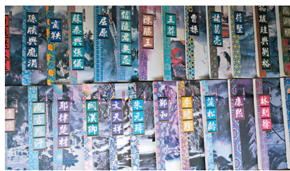
麗江王丕震創作的部分歷史小說。