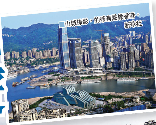
重慶因高低錯落的地勢，依山而起的摩天高樓，成為影視拍攝新寵。