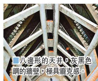
八邊形的天井，灰黑色調的牆壁，極具龐克感。

海棠溪筒子樓曾經是一線江景房，筒子樓分兩棟，共13層，主要入口位於第七層，《少年的你》女主角陳念便是經過7層的走廊日常進出，電影中的樓層過道張貼滿了催賬單，現實中也是如此。八邊形的天井，灰黑色調的牆壁，老舊的Z字樓梯，這棟建築兼具年代感與現代龐克元素。筒子樓天井縱貫上下，八邊形對應每層八戶人家，電影中用來拍追逐戲的Z字形樓梯縱橫交錯，從天井連往天台，形成樓內獨特風景線。站在底層仰望，頗有坐井觀天之感，旁邊黑壓壓，只剩頭頂有光，不禁讓人聯想到電影裏那句經典台詞「我們生活在陰溝裏，但依然有人仰望星空」。這裏仍舊生活着數家居民，以年紀大的婆婆、爺爺為主，氣氛安靜，沒有物業、沒有門禁、理髮5元人民幣。如今筒子樓因《少年的你》而每日引來無數打卡遊客，當地居民頗有微詞。一名在此居住了20年的婆婆告訴記者：「這房子我們是自己買的，不是公園，也不是旅遊景點……來往遊客太多，吃剩下的食物隨意亂扔，給我們住戶造成了很多困擾。」當地街道也在考慮為筒子樓加裝門禁，遊客今後或將不能隨意打卡。地址：重慶南岸區海棠溪正街32號