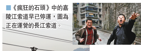
《瘋狂的石頭》中的嘉陵江索道早已停運，圖為正在運營的長江索道。

作為在重慶市中心取景最著名的影片之一，電影故事的開頭，謝小盟勾搭姑娘的纜車是重慶嘉陵江索道，不過嘉陵江索道已經在2011年停運，兩年後拆除，但長江索道仍在運營，成為當地最有名的觀光打卡地。影片主要取景地除了重慶長江索道外，就是渝中區羅漢寺片區：道哥第一次偷翡翠的追擊戰就是在寺內發生的，後來黑皮從下水道裏爬出來，也是羅漢寺附近。