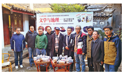
舉辦「文學與地理——當下中國文學與城鄉生態」論壇向文學前輩致敬。