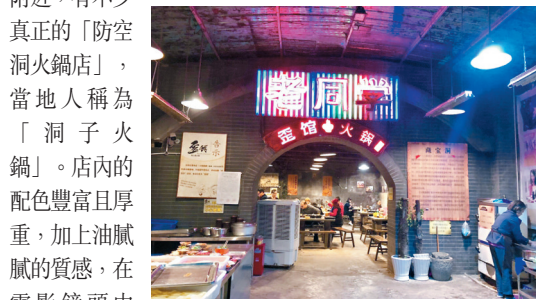
《火鍋英雄》將「防空洞火鍋」呈現於觀眾眼前

楊慶導演為觀眾呈現了屬於重慶的諸多特徵——防空洞火鍋、燈紅酒綠的江岸，以及犯罪動作片需要的高低錯落的空間，影片幾乎所有外景都取自重慶。防空洞是抗日戰爭時期，國民政府為了躲避日軍的轟炸，依托山城特色在重慶修建的人工洞穴。防空洞內部幽暗狹長，成為後人夏日食涼的絕佳去處，也有不少商家利用防空洞「天然空調」的優勢經營起火鍋店。在渝中區兩路口與儲奇門附近，有不少真正的「防空洞火鍋店」，當地人稱為「洞子火鍋」。店內的配色豐富且厚膩，加上油膩膩的質感，在電影鏡頭中顯得輕鬆而詭異。