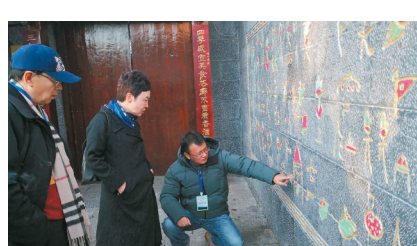
麗江古城東巴文字壁。