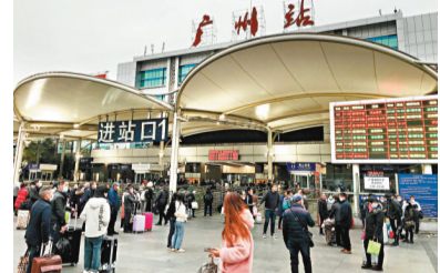
廣州火車站已有旅客提前返鄉。

香港文匯報訊（記者 敖敬輝 廣州報道）春節臨近，不少人已提前計劃返鄉或旅行。根據中國購買火車票方案，1月9日可購買2月7日的車票，網上搶票迎來高峰。經查詢，以廣州、深圳出發為例，2月7日前往湖南、江西、四川、重慶等熱門方向的高鐵列車車票幾乎「開闢」即售罄，普通列車亦僅剩下少量的坐票或無座票。受訪旅客表示，目前中國零星散發疫情出現，防控形勢趨緊，但相信整體疫情能夠受控，在做好個人防護的前提下，還是會選擇返鄉過年。