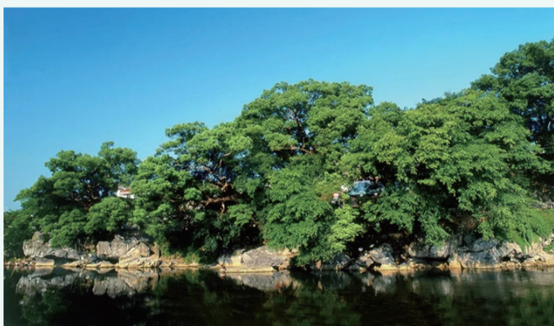
◆武平縣以“林改策源·天然氧吧”入選中國候鳥旅養小城百佳榜——五谷豐登全國四佳 ◆長汀縣以“兩山示範·最美山城”入選中國候鳥旅養小城百佳榜——山花爛漫全國四佳

近日，2020中國候鳥旅養小城百佳榜在第四屆中國(貴州)康博會上發榜公示，全國2861座縣域(含市縣區)城市中僅有100座小城最終入榜，福建7座小城入圍，龍岩武平縣、長汀縣榜上有名。