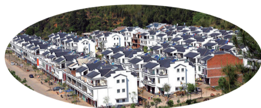
這是連城縣宣和鄉培田新村一景，當地群眾日子越過越好。(資料圖)

日前，連城縣委召開十三屆十二次全會，深入學習貫徹黨的十九屆五中全會、省委十屆十一次全會和市委五屆十二次全會精神。全會高度評價了連城決勝全面建成小康社會取得的決定性成就，深入分析新發展階段連城發展的機遇和挑戰，提出了“十四五”時期經濟社會發展總體要求、主要目標和二〇三五年遠景目標。全會要求，堅持傳承紅色基因、人民至上、發展第一要務、底線思維“四個理念”，做足做實全面加強黨的建設、全力加快產業發展、全員建設國際山水旅遊度假城市、全心補齊民生短板“四篇文章”，打造有溫度的幸福連城。