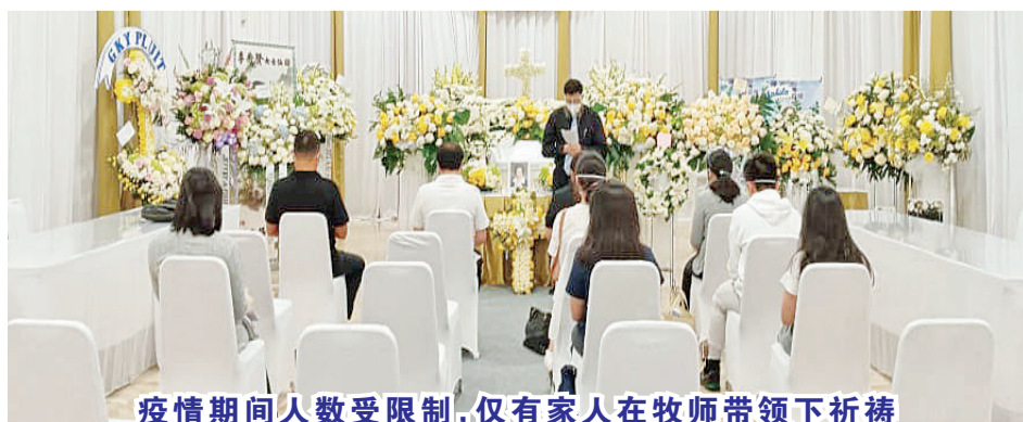
疫情期间人数受限制,仅有家人在牧师带领下祈祷