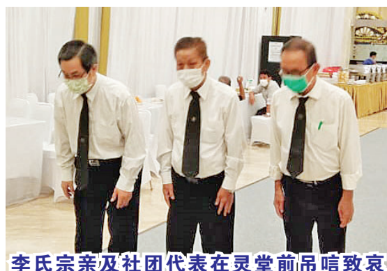
李氏宗亲及社团代表在灵堂前吊唁致哀