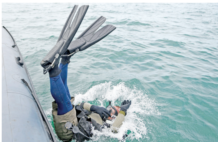
印尼海军第一海军陆战队两栖侦察营士兵潜水搜寻。