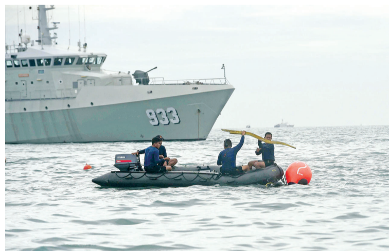
搜救人员在千岛群岛海域打捞起客机残骸。