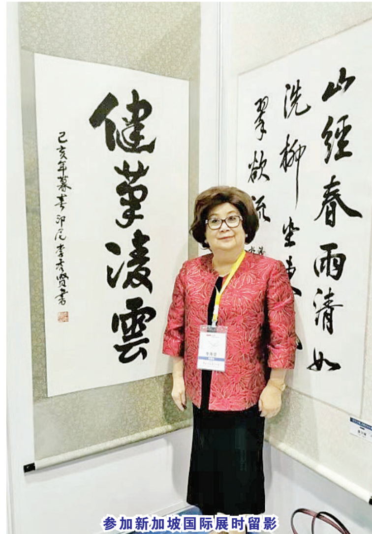
参加新加坡国际展时留影