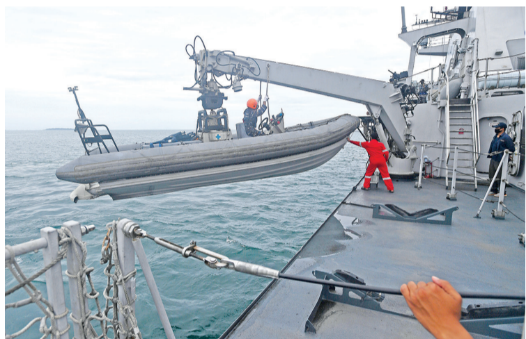
印尼海军舰船放下救生艇进行搜寻。