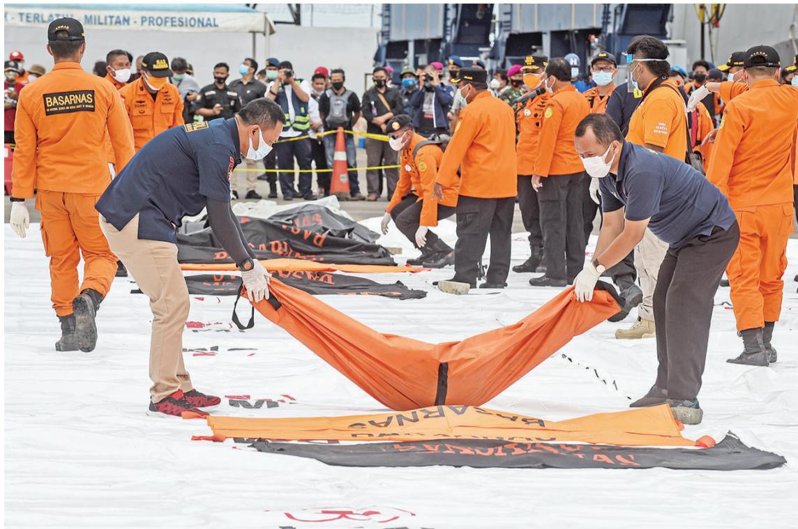
搜救人员在雅加达戈戎不碌港搬运打捞起的失事客机遇难者遗体。

当地时间9日14时36分,印尼三佛齐航空公司这架载有62人的波音737-500客机从雅加达国际机场起飞,前往西加里曼丹