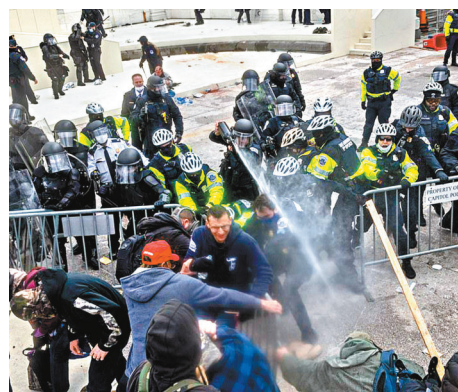
美暴徒圖突破警察的障礙。網上圖片