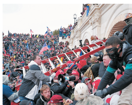
「特粉」用鐵梯衝擊美國國會大樓。