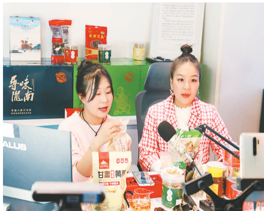
阿里巴巴旗下“聚划算百亿补贴”平台开展消费扶贫新举措，餐桌补贴再升级专场农产品直播带货活动，助力甘肃特色产业、油橄榄、花椒等数百种扶贫农产品进入“聚划算百亿补贴”的直播间，全力在线助推消费扶贫。

专家表示，新国货要跟上年轻消费者，跟上这个时代的消费市场变革。通过对消费诉求的洞察细分，用高品质、高性价比的产品来赢得消费者的青睐，提升品牌自身的核心竞争力。