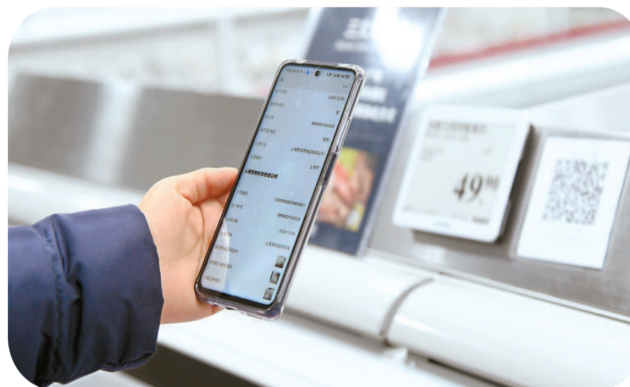
在北京顺义区后沙峪山姆会员商店，市民通过扫描二维码的方式了解冷链产品的来源、核酸检测证明等信息。