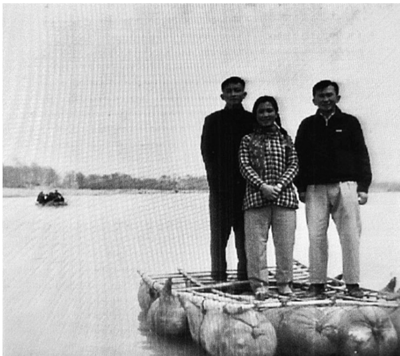
和归侨同学在兰州乘羊皮筏横渡黄河