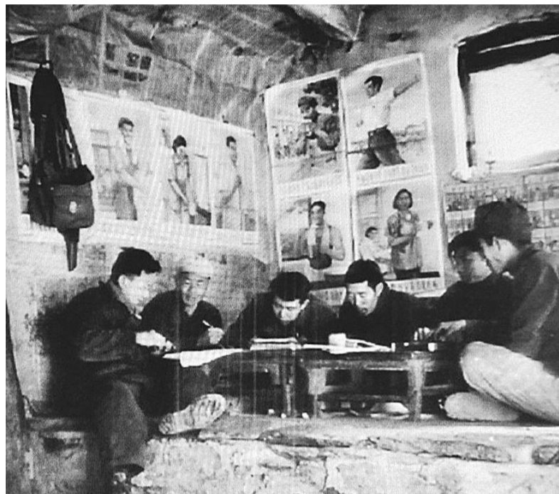
1956年春,参加北京农业合作化运动