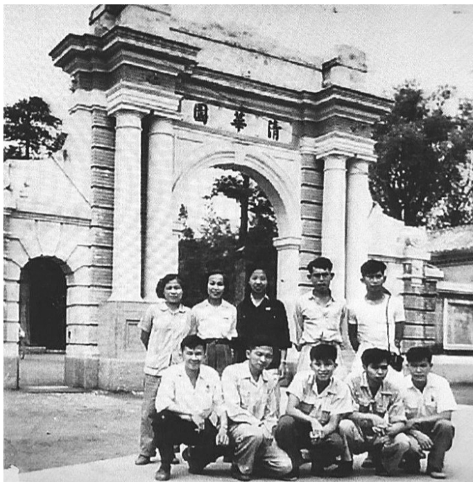
1953年,清华大学的归侨学生合影

共和国建国70年来,我们迎来了中华民族振兴的辉煌时代,我们亲身见证了香港回归祖国;我们亲身经历了共和国从贫穷落后走向繁荣富强,成为世界强国。此时此刻,我感到十分幸运,感到无比自豪!