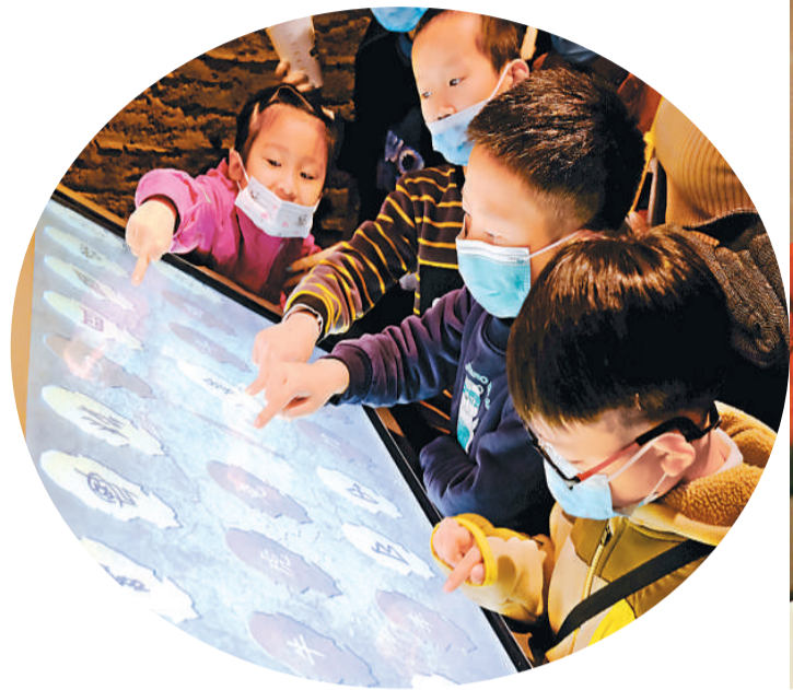
左图：小朋友们在河南博物院体验触屏设备。右图：观众欣赏“泱泱华夏·择中建都”基本陈列展出的金缕玉衣。