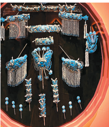
展厅里的点绸头面

此次展览是继不久前结束的“2020北京·中国弓弦艺术节”后，国戏与国博战略合作的又一项新举措。据悉，展览大约持续2个月。