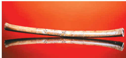
河南博物院“镇院之宝”贾湖骨笛