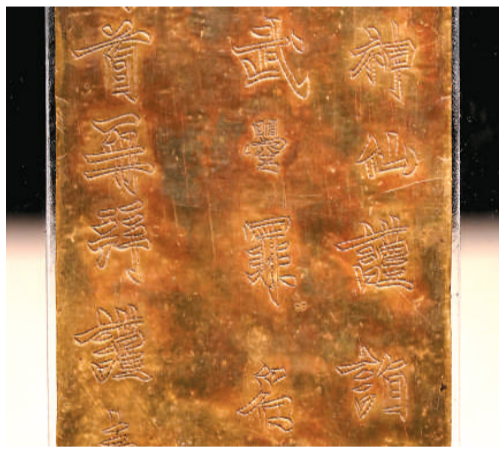
河南博物院“镇院之宝”武烈天金筒（局部）

主展馆试运行期间观众没能看到的“镇院之宝”云纹铜禁，在“丹渐吉金——中原楚国青铜艺术”展中亮相。春秋时期，丹渐流域是楚文化滥觞之地，楚人在此留下了丰富的文化遗存。这次展出的浙川东周楚墓青铜器，以其富丽纹饰和精湛工