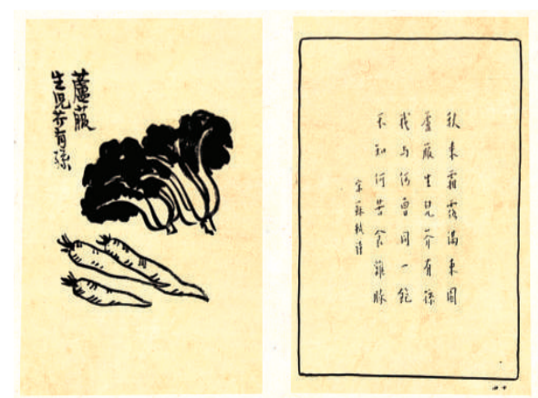
《护生画初集》手稿，浙江省博物馆藏

熠熠生辉的戏服、弥足珍贵的黑胶唱片、五光十色的舞台剧照……2020年12月26日，由中国国家博物馆与中国戏曲学院联合主办的“薪火相传——