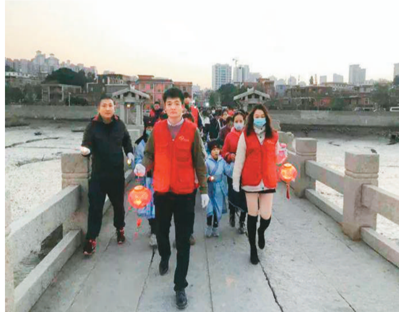
图为孩子们和志愿者们一起走过古桥,祈福新年。

规划远期展望至2035年。届时,粤港澳大湾区文化事业、文化产业和旅游业实现高质量发展,社会文明程度达到新高度,文化软实力显著增强,中华文化影响力进一步提升,多元文化进一步交流融合,世界级旅游目的地竞争力、影响力进一步增强。