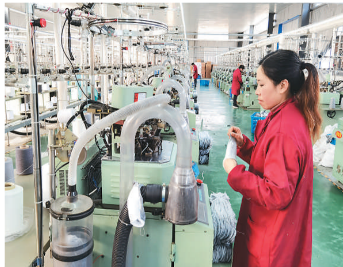
近期,湖北省十堰市房县工业企业生产一片繁忙,赶制耳罩、纺织、防护服等一批农产品,销往多个国家。图为1月3日,在位于房县白鹤镇赤岩村的房县卓琳袜业有限公司,工人正在生产棉袜。