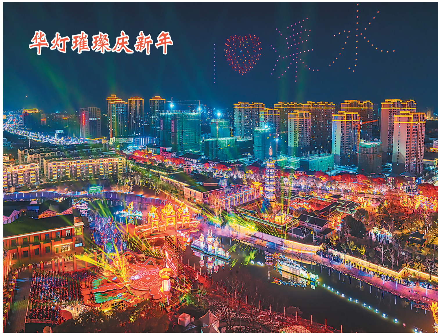
江苏省南京市溧水第四届秦淮源头灯会近日亮灯,灯会将持续到3月底。灯会包括“万家灯火·欢乐溧水”“绚丽名城·悦动溧水”“唐风古韵·梦回千年”“根深叶茂·智造溧水”等4个主题板块,共86组灯组,让市民游客真切感受到盛世欢腾、吉祥如意的节日氛围。

生种群增至1864只,朱鹮野外种群和人工繁育种群总数超过4000只,亚洲象野外种群增至300头,藏羚羊野外种群恢复到30万只以上。 中国还采取就地保护、迁地保护、回归自然等措施,持续开展珍稀濒危野生动植物保护。目前,中国建有近200个各级各类植物园,收集保存了2万多个物种,占中国植物区系的2/3,基本完成了苏铁、棕榈和原产中国的重点兰科、木兰科植物等珍稀野生植物的种质资源收集保存。野外回归约120个物种,其中多为中国特有种。