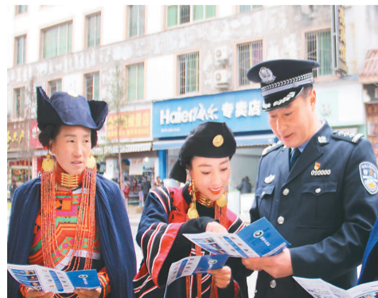
新年伊始,四川省凉山彝族自治州美姑县委禁毒办、县公安局深入边远山区开展禁毒法治宣传教育活动,为当地百姓讲解禁毒和脱贫攻坚相关政策。图为1月4日,美姑县委禁毒办和公安民警在街头进行禁毒法治宣传。