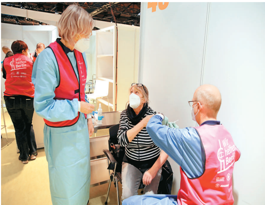
2020年12月27日，在德国柏林，一名女子接种新冠疫苗。

抗疫成效较好的东亚国家在发现变异病毒病例后，也实施了更为严格的人境政策。日韩两国在发现变异新