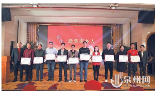
▲2020“泉州最美家鄉人”頒獎典禮

日前，2020泉州“最美家鄉人”頒獎典禮暨東南公益年度盛典在泉州華僑大廈舉行，愛心人士、愛心企業代表、泉州多個公益團隊負責人以及讀者朋友等300餘人齊聚一堂，銘記溫暖，凝聚力量，守護希望，為愛出發。