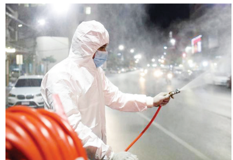
当地时间2021年1月4日，泰国曼谷，一名工作人员上街喷洒消毒剂。

中新网1月5日电 据新加坡《联合早报》报道，泰国4日新增新冠确诊病例745例，创下疫情暴发以来的最高值。泰国总理巴育促请民众合作，尽量居家隔离，否则政府须实施严格的封锁措施来制止疫情扩散。