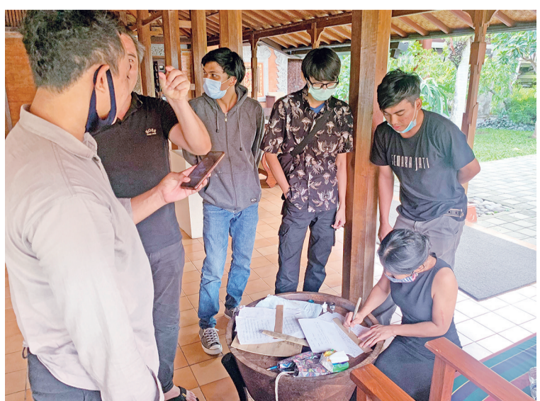
帕拉西艺术家指导记者进行简单雕刻绘画

何现代化机器参与,最能反映巴厘岛最真实的文化。作为一名土生土长的巴厘岛人和艺术家,我有责任要把此独一无二的文化推广给世人。首先,学生是我们重点培养的目标,我们会尽量定期在大学中推广和介绍此艺术,并希望能纳入到巴厘岛普通大学高校的课堂中。我本人多年在新加拉惹大学授课讲解帕拉西文化;同时,每年都在巴厘岛及世界各地进行艺术展,如2018年在沙努格莱亚桑川酒店进行帕拉西艺术展;2019年与4名帕拉西艺术家在美国加州的加州书籍中心(California Center for the Book)进行帕拉西艺术展。在2021年1月,我们会安排几场系统的帕拉西工作坊(Prasi Workshop),号召更多人来参与并亲身体验帕拉西文化的雕刻制作。 问:您将如何让更多巴厘岛人或者未来国际